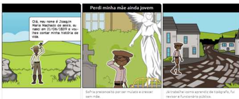
Figura 1: História em Quadrinhos produzida pelos alunos

A análise a seguir refere-se ao conteúdo de alguns balões e quadrinhos de dois textos do gênero HQ, produzidos por grupos diferentes de alunos concernentes à biografia de Machado de Assis, o que constituirá o corpus deste estudo. Os quadrinhos foram selecionados tendo em vista as peculiaridades do que é proposto pela Semiótica de Greimas, na qual se analisam, na visualidade, a topologia, cores, formas e de como esses elementos estão associados ao plano do conteúdo.