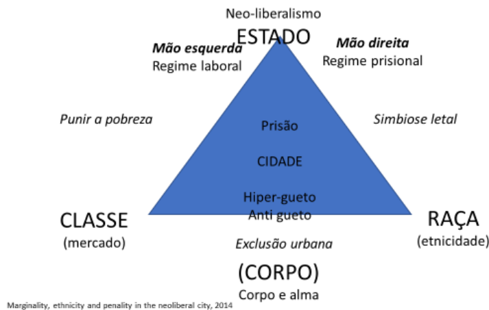
Figura 2. Teoria de Loïc Wacquant, segundo o próprio

A primeira pergunta a esclarecer será: de que modo as elites estão implicadas nas torturas que regular e reconhecidamente se praticam nas cadeias? Porque é que os mesmos estados que subscrevem tratados internacionais de direitos humanos e se agrupam em instâncias internacionais que definem critérios de avaliação de organizações penitenciárias legítimas, não só violam as suas próprias leis, mas também negam, esforçada e pateticamente, os factos evidentes e conhecidos, remetendo-os para o segredo penitenciário, laboriosamente produzido pela censura oficiosa?