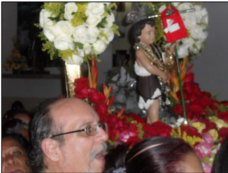
Imagen 6: Llegada del San Juan Niño a la celebración de la Santa. Tomado por Humberto Mayora en Junio 2015.