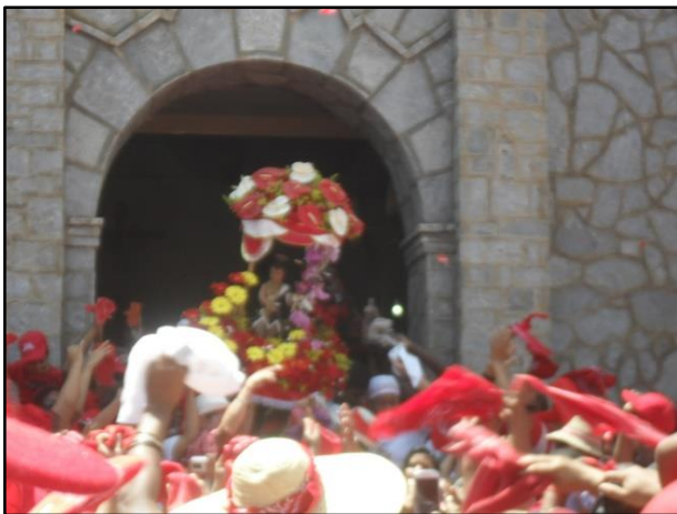
Imagen 11: Salida del San Juan de la Iglesia, Imagen tomada por Humberto Mayora, junio 2014

Fiesta: regocijo público para que el pueblo se recree organizado comúnmente cuando se conmemora una solemnidad. En las siguientes imágenes se observan estos tres elementos considerados como la expresión de la teatralidad en estas fiestas.