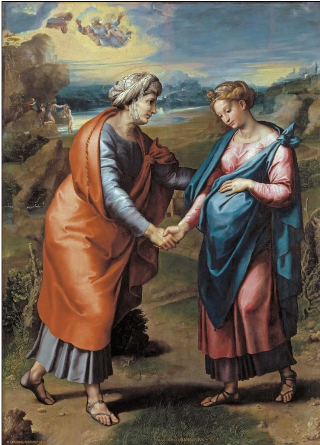
Imagen 2: Visita de María a su prima Isabel compartiendo la dicha de estar encintas.

Años más tarde Juan permaneció en el desierto viviendo con los Esenios manteniéndose limpio de mente y espíritu y aguardaba la llegada del mesías y cumplió con la orden hecha por su padre desde que nació y