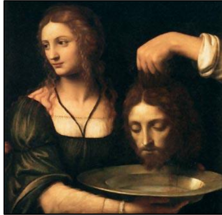
Imagen 4: Salomé recibe la cabeza del Bautista, cuadro de Bernardino Luini, tomada de http://www.biografiasyvidas.com/biografia/s/salome.htm .

Estas dos importantes celebraciones del año las trasladó el emperador romano Constantino al cristianismo católico y el 25 de diciembre se celebra el nacimiento de nuestro Señor Jesucristo y el 24 de junio el nacimiento de Juan el Bautista, tal y como las santas escrituras lo afirman. Es importante destacar que el cristianismo tanto en la religión católica como la cristiana evangélica para solo citar como ejemplos se mantiene la convicción de que el agua toma proporciones majestuosas en el sacramento del bautismo.