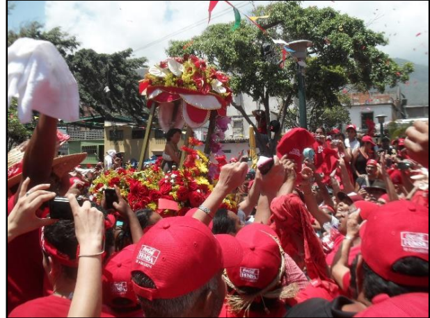
Imagen 14: Baile a San Juan Bautista. Imagen tomada por Humberto Mayora, junio 2014