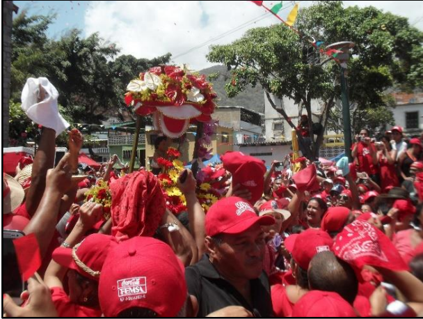
Imagen 13: Repique del primer toque de tambores frente a la iglesia, Imagen tomada por Humberto Mayora, junio 2014