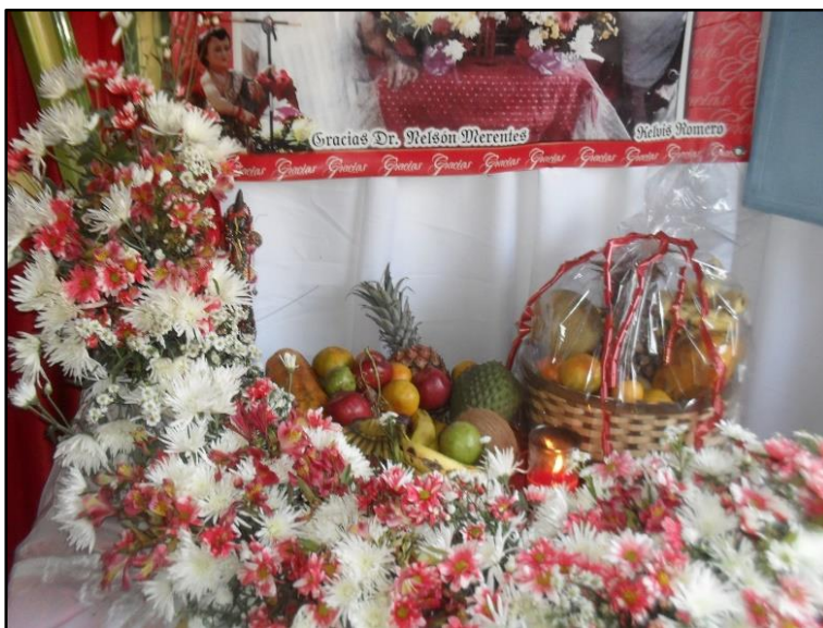
Imagen 8: Lugar de recepción de ofrendas en la casa de la Familia Corro. Tomado por Humberto Mayora en junio 2014.