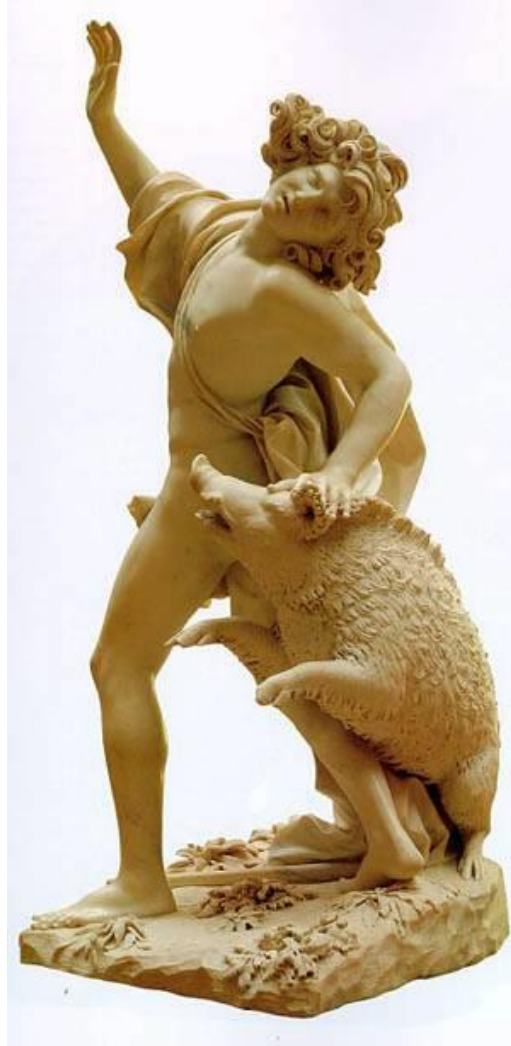
Imagen 10: Adonis atacado por el jábali antes de morir