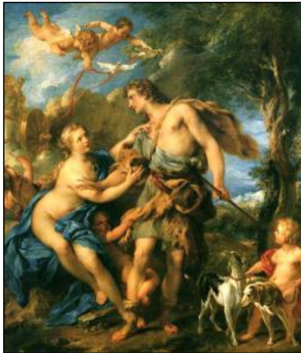
Imagen 9: Afrodita y Adonis

Afrodita es la Diosa del amor erótico, esposa de Hefesto y amante de Ares, en contrario con Adonis que era mucho menor que Afrodita quien se enamoró perdidamente del joven y con quien quería consumir todas las pasiones que vivía con su amante y esposo pero no fue así, nunca estuvo con él pero despertó la ira y los celos de Ares quien no soportó esta posibilidad y convertido en Jabalí le causó la muerte al joven Adonis. Por eso parte de las estrofas de este canto en hombres y mujeres antes descrito narra una súplica de Juan a Juana de Tarmas por las 4 heridas de puñaladas que les dejó su marido. La trascendencia del mito se observa en los fieles que año tras año le piden amor, mujer o marido, embarazos y en el apogeo de los tambores mujeres y hombres se conectan con la energía de la atracción y el erotismo mediante el baile con en la aproximación de sus cuerpos en los ritmos de tambor, otros con deseos de pedir salud, esperanza, prosperidad y abundancia.