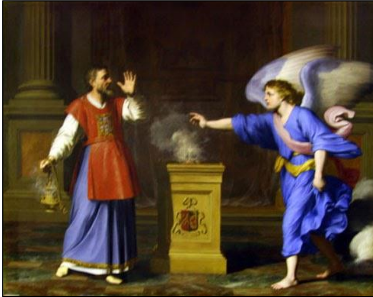
Imagen 1: Zacarías y el Ángel Gabriel quien vaticina el nacimiento de Juan

Al octavo día del nacimiento de Juan lo llevaron al templo para circuncidarle su padre Zacarías; El cual exclamó “Oh bendito señor Dios de Israel y a esto da mi vejez y es todo un hijo quien prepara el camino del salvador que vendrá a salvarnos de nuestros pecados” , Zacarías volvió a hablar y todos en el pueblo lo anunciaron diciendo es un milagro. En agradecimiento a Dios por el futuro rol de Juan junto a Jesús le dijo “Y tu niño, serás llamado profeta del Altísimo, pues irás delante del Señor, para preparar sus caminos, y dar a su pueblo conocimiento de la salvación por el perdón de sus pecados...” (Lc 2-76-78).