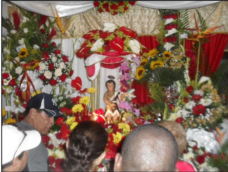
Imagen 7: Casa de la Familia Corro, veneración de Juan el Bautista . Tomado por Humberto Mayora en junio 2014.