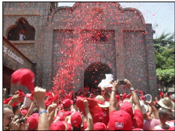
Imagen 12: Lluvia de confetis en la salida del San Juan de la Iglesia, Imagen tomada por Humberto Mayora, junio 2014