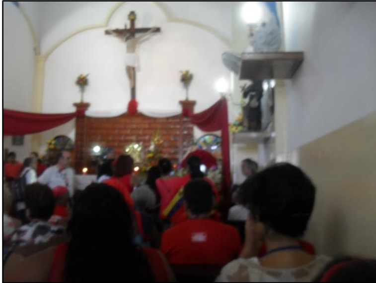
Imagen 5: Celebración de la misa en la Iglesia de Naiguatá.