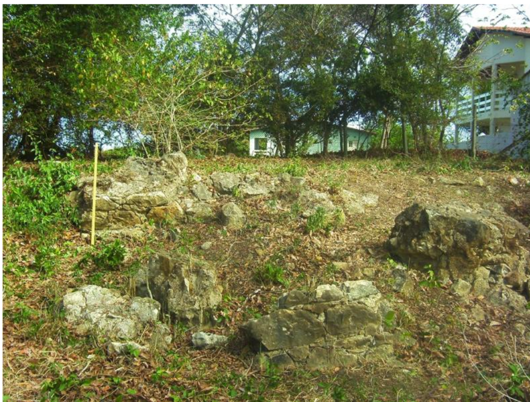
Figura 05: Vestígios arqueológicos pertencentes ao antigo fortim da Catuama, no extremo norte da ilha de Itamaracá.

foram levantadas durante a execução do projeto “Patrimônio Arqueológico Subaquático do Litoral de Pernambuco”, em 2009, pelo Laboratório de Arqueologia da Universidade Federal Rural de Pernambuco.