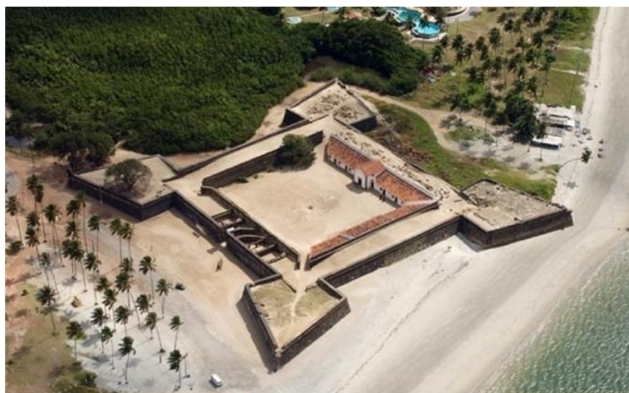
Figura 02: Vista aérea do Forte Orange.

É possível observar estas características do forte Orange na ilustração 2, apesar de que as estruturas atuais deste forte terem, basicamente, origem portuguesa pós-restauração, ainda preserva-se o padrão básico da antiga unidade.