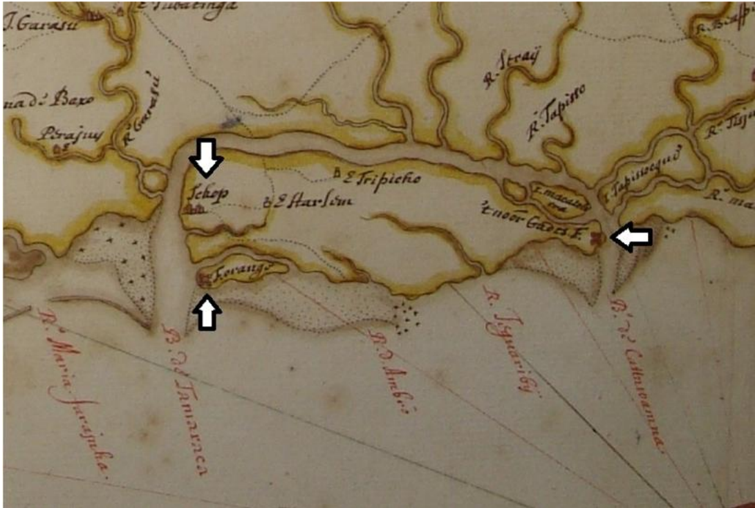
Figura 04: Johannes Vingboons. Capitania de Itamaricá. 1665. Detalhe. Recorte da Ilha de Itamaracá de uma imagem produzida por Vingboons. O desenho original apresenta um amplo panorama da Capitania de Itamaracá de maneira geral. Marcações nossas. As setas indicam, o Fortim da Catuama, o Forte Orange e a Vila Schoop.