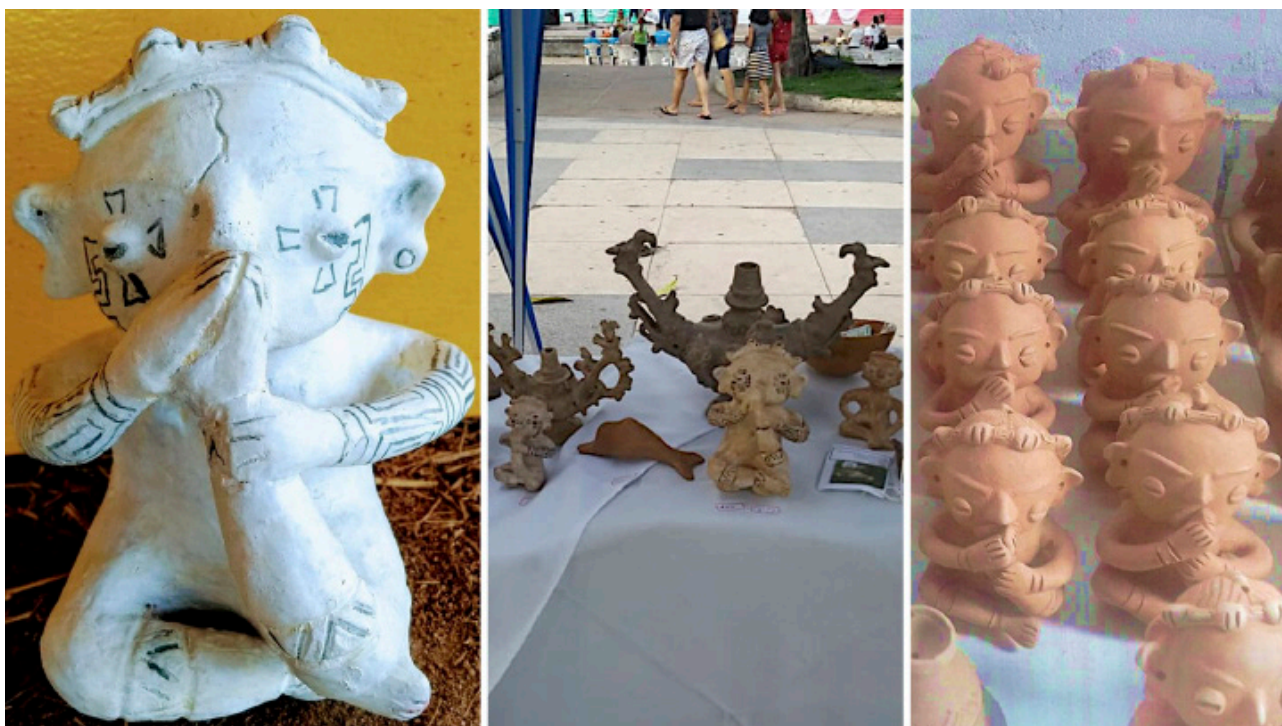
Figura 4: Posts retratando e/ou anunciando réplicas da pé na boca em contas comerciais no Facebook. Esquerda – réplica à venda na página da cooperativa Puxirum; Centro – réplicas à venda em feira de rua da página da cooperativa Puxirum; à direita – réplicas à venda na Cerâmica Tapajônica-Cópias.

desconto para professores e alunos” em um post, enquanto outro post mostra réplica da pé na boca em fotos da exposição “Sonoridade Ancestral”, produzida para receber turistas de 24 cruzeiros transatlânticos (G1 SANTARÉM, 2019).