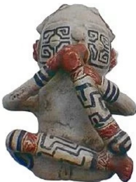
Figura 2: réplica da pé na boca anunciada como ‘Estatueta Tapajônica pé-na-boca’, custando R$ 264.

Poucas décadas separam esses primeiros estudos acadêmicos da pé na boca e seus sucessores, significando uma ruptura nos pressupostos das pesquisas intrincadas em seus contextos históricos. Antes de explorar essa mudança de perspectiva a seguir, faço uma nota sobre a relação entre arqueólogos e agentes fora da comunidade acadêmica. Na atualidade, há um entendimento público da pé na boca como criança, uma vez que o ato de colocar o pé na boca evoca a imagem de uma criança (Denise Schaan, comunicação pessoal). Essa forma lúdica de representar um objeto arqueológico é interessante, especialmente considerando que, há um século, sua interpretação envolvia a associação com práticas indígenas contemporâneas (entendida como degradante no imaginário popular) ou valor cultural para os turistas. Este valor cultural atribuído aos objetos arqueológicos confere valor econômico tanto aos objetos como às suas réplicas (Frade, 2003). Com isso, a comercialização de réplicas de artefatos arqueológicos é dinamizada mesmo em sites de venda pela internet – incluindo réplicas de estatuetas pé na boca (Figura 2). Segundo Holtorf (2002, p. 55), os efeitos das réplicas podem variar “em diferentes circunstâncias e para diferentes pessoas”. A seguir, são delineados alguns aspectos e discursos sobre o processo de replicação na Amazônia.