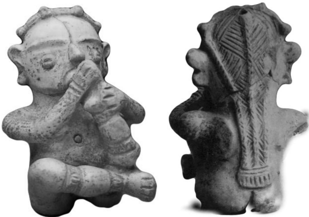
Figura 1: Frente e verso da estatueta de pé na boca. Adaptado de Palmatary 1960.

A estatueta pé na boca (Figura 1) faz parte de um subconjunto de cerâmicas na forma de corpos, cabeças, e torsos humanos, que compõem o acervo de Frederico Barata sob custódia do MPEG. Este subconjunto corresponde ao material do sítio Aldeia em Santarém, escavado por Barata (1953) em uma feição em forma de sino. Barata era arqueólogo, jornalista e artista plástico e interessava-se pelos aspectos artísticos dos objetos e foi o primeiro pesquisador a estudar esta estatueta.. Seus trabalhos de pesquisa sobre as peças de Santarém fornecem descrições detalhadas das escavações e análises refinadas das características decorativas da cerâmica, propondo uma potencial representatividade das decorações e reformulando a forma de ler a cultura material de Santarém.