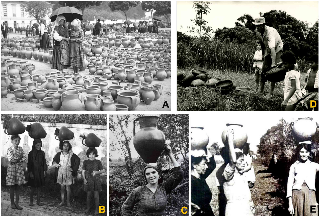
Figura 4. A) produção de oleiros vendida por mulheres na feira de Barcelos, Portugal, em 1935 ; B) meninas com cântaro em 1944, Vagos, Aveiro ; C) mulher com cântaro, Parada de Gattim, Moncorvo ; D) vasilhas de uma ceramista de Iguape, São Paulo, prontas para serem transportadas por via fluvial para venda, em 1973 ; E) mulheres carregando água no pote ou boião, Jairê, Iguape, em 1945.