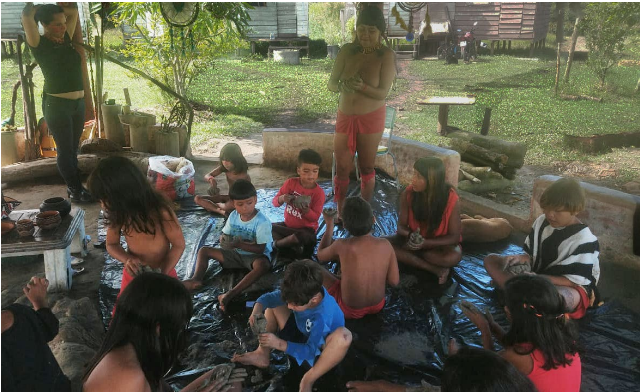
Figura 6. Comunidade Tabaçu rekoopy, TI Piaçaguera, município de Peruíbe, São Paulo, no de resgate da prática cerâmica em 2022.

O resgate é possível de várias maneiras, devendo ser conduzido pelas comunidades Tupi Guarani (Figura 6), em colaboração com pessoas capazes de integrar diversos tipos de conteúdos que eles desejam recuperar. A mais evidente é ter quem lhes forneça as técnicas da prática cerâmica, algo que as próprias ceramistas do Vale do Ribeira poderiam contribuir, muitas delas herdeiras das ceramistas do passado. Seria interessante ampliar a colaboração para arqueologia e a museologia, levando-os a examinar vasilhas feitas em diferentes tempos e lugares da constelação que produzia a cerâmica paulista, para compartilhar com as próprias ceramistas do presente. E, também, incluir informações históricas, de linguagem e das memórias das comunidades, famílias e pessoas do passado, que podem ser encontradas em vários tipos de fontes.