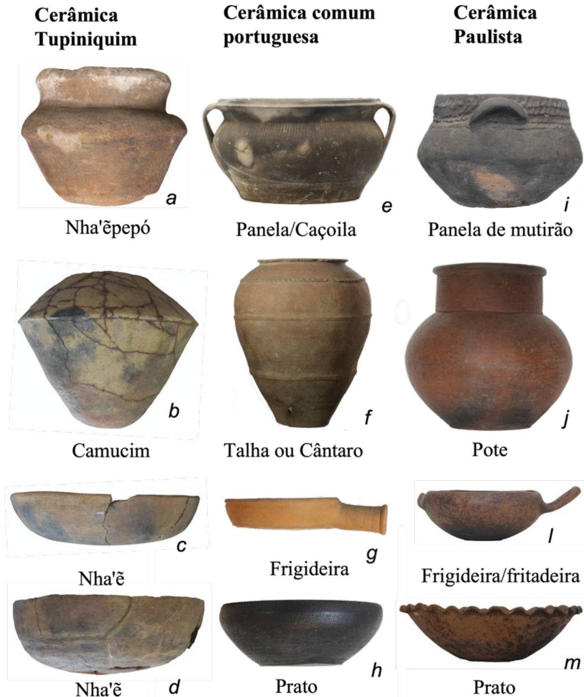
Figure 3. Coluna Cerâmica Tupiniquim. a: Nha'ëpépó, Museu Histórico e Arqueológico de Peruíbe; b, c & d: Camucim e nha'ë (Museu Nacional do Rio de Janeiro); Coluna Cerâmica Comum Portuguesa. e, f, g & h: Panela çaçoila, talha cântaro, frigideira, prato (Museu de Barcelos, Portugal); Coluna Cerâmica Paulista. i, j, l & m: Panela, pote, frigideira, prato (Museu de Arqueologia e Etnologia da Universidade Federal do Paraná).

A Cerâmica Paulista teve duas línguas compartilhadas ao mesmo tempo, mas nem sempre o mesmo espaço. Não foi uma mera circulação de palavras e ideias, mas a materialização de escolhas tecnológicas, sentidos e relações específicos. Ela foi reproduzida e continuamente usada em uma realidade social dinâmica marcada por interações entre pessoas, situações e valores culturais (PERRONE-MOISÉS, 1999). De modo semelhante ao que ocorreu entre os habitantes nativos de Martha's Vineyard (BRAGDON, 2010), evidências sugerem que parte das ceramistas paulistas na-