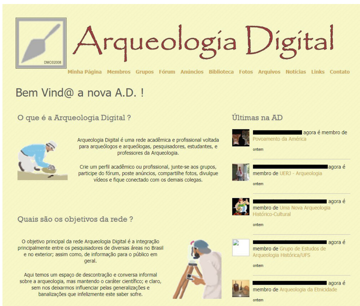
Figura 4: Captura de tela da rede social arqueologiadigital.com em 2014.

A terceira, e mais significativa versão da rede ocorreu em 2018, quando a hospedagem mudou de plataforma. Esta mudança teve seu “preço”, primeiro porque grande parte do conteúdo criado e acumulado durante mais de 10 anos de operação da rede ficou retido no antigo provedor, e, portanto, nem tudo foi possível migrar para a nova plataforma. E em segundo, porque a rede arqueologiadigital.com teve que praticamente ser repensada para um formato totalmente novo, mais formal e menos funcional. Esta mudança radical na estética da plataforma também refletiu nas interações dos públicos com a rede, que deixou de ser um repositório individual e passou a ser um distribuidor coletivo de informações.