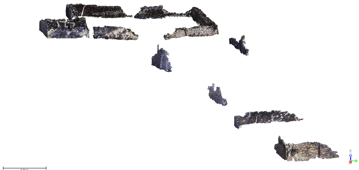
Figura 1: Maquete eletrônica em nuvem de pontos do sítio arqueológico histórico das Lavras do Abade.

Com o escaneamento 3D do sítio arqueológico, foi possível então, criar uma maquete eletrônica em escala natural do sítio, ou seja 1:1; onde os pormenores das estruturas construtivas foram capturados com uma altíssima resolução, e precisão de espaçamento entre pontos com menos de 1,5 mm de distância. Isto propiciou a reconstrução em meio digital da percepção de materialidade presente nas Lavras do Abade com extrema acurácia; e com isso também, a emulação artificial das superfícies existentes com todas as suas texturas, cores, dimensões, volumes, localizações; simulando com uma exatidão acentuada a sua existência na realidade.