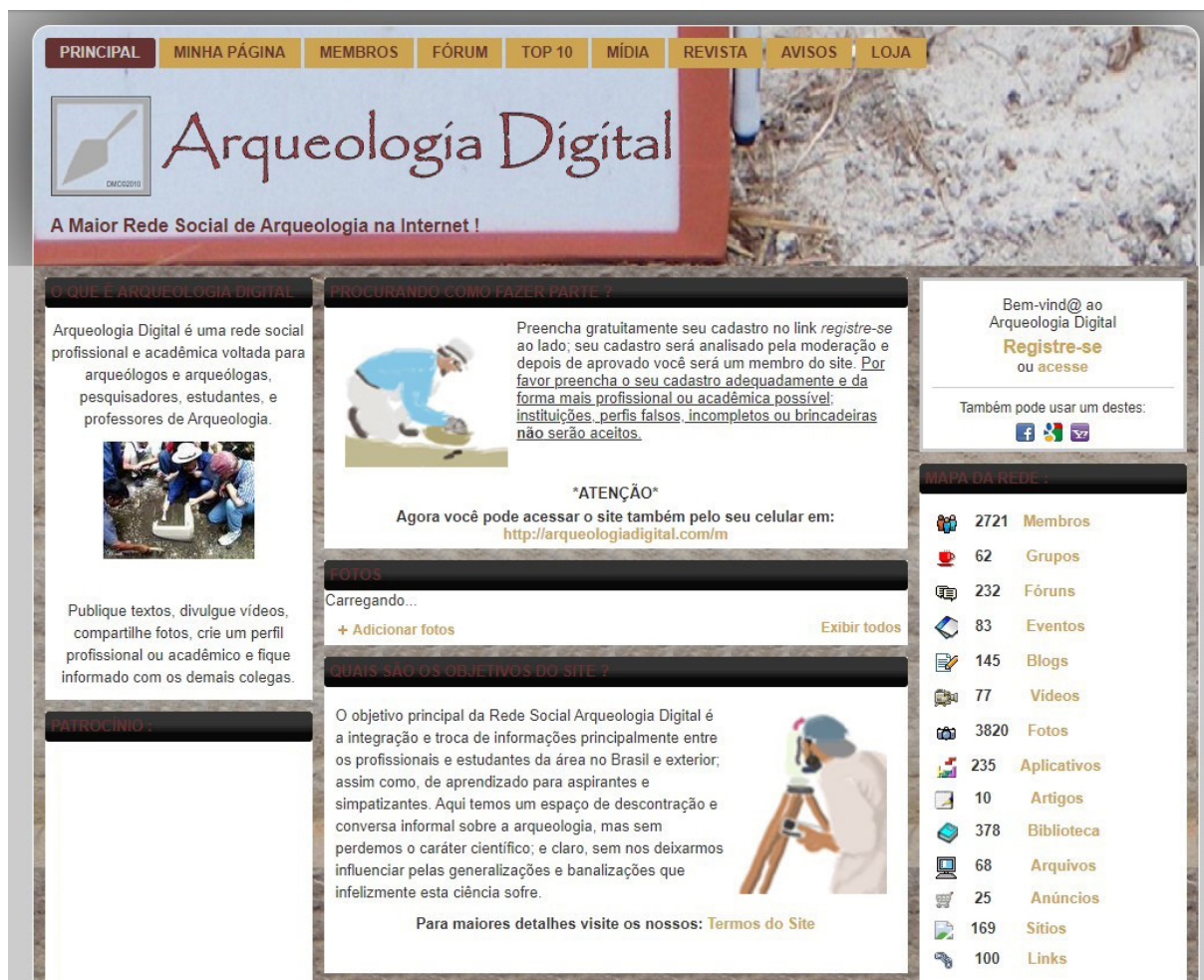
Figura 3: Captura de tela da rede social arqueologiadigital.com em 2010.

A segunda versão da rede ocorreu de 2014 até 2017 quando a própria plataforma em que estava hospedada a rede passou novamente por mudanças significativas, tanto na sua estrutura quanto comercialmente. Neste período o carregamento de conteúdo teve que ser hospedado fora da rede, e a prioridade foi dada somente as discussões, assim como a estética da interface individual do usuário. A partir de 2014 a rede arqueologiadigital.com também começa a expandir para outras plataformas digitais, tanto sociais como de conteúdo, e não mais limitando seu foco somente aos integrantes, ampliando a troca de informações com o público externo.