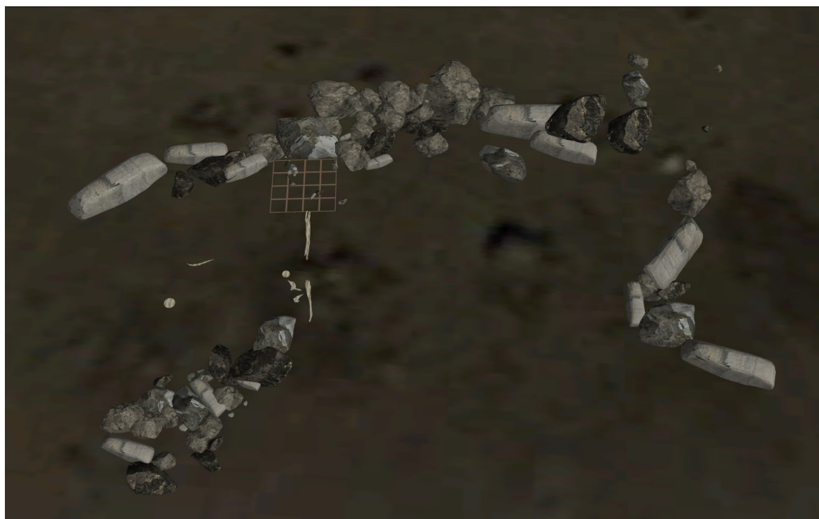
Figura 6: Modelo digital em 3D do sítio arqueológico histórico antártico PX1.

Esta experiência teve por objetivo principal o acesso do público aos resultados da pesquisa na antártica, para tanto o modelo eletrônico foi também disponibilizado através de uma plataforma específica na Internet, para a incorporação e acesso a todos os outros dados da pesquisa.