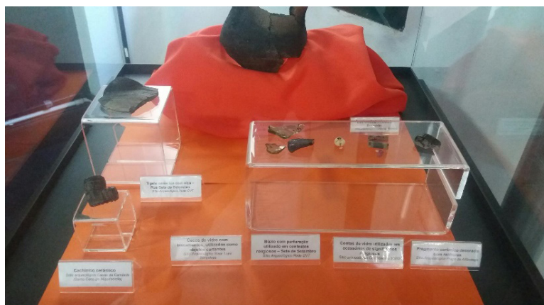
Foto 3: Vitrine colocada do lado do mapa, mostrando os diferentes objetos encontrados nas escavações da cidade, relacionado aos escravizados.

Nesta mesma sala também há dois fragmentos de cerâmicas atribuídos aos escravizados, porém sem muita informação. Esses objetos foram encontrados em uma lixeira coletiva, junto a outros objetos também expostas no painel, como louça, penicos, botões, frascos de vidro, etc.