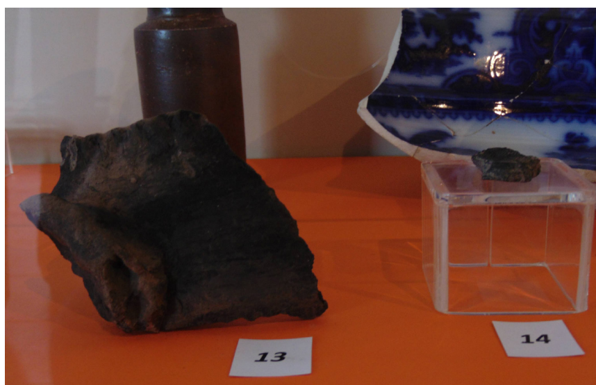
Foto 4: Dois fragmentos de cerâmica (nº 13 e 14) relacionadas à produção dos africanos e/ou afrodescendentes expostos no painel: “Transformações urbanas”.

Nesta mesma sala também há dois fragmentos de cerâmicas atribuídos aos escravizados, porém sem muita informação. Esses objetos foram encontrados em uma lixeira coletiva, junto a outros objetos também expostas no painel, como louça, penicos, botões, frascos de vidro, etc.