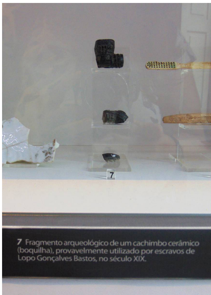
Foto 2: Fragmentos de cachimbos expostos no Painel “O Solar que virou museu: memórias e histórias”.