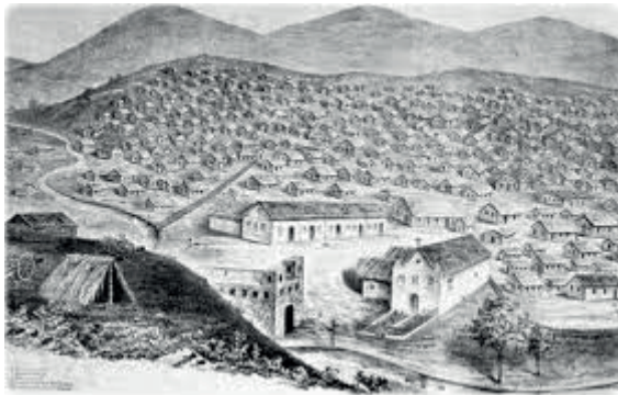
Ilustração de Canudos à época da guerra.

da guerra permanecem no imaginário popular e nas imagens das literaturas e filmes nacionais do ciclo canadiano, que continuam a narrar este acontecimento obscuro como dispositivo para cartografar sua contemporaneidade. Pois, como define Giorgio Agamben, “o contemporâneo não é apenas aquele que, percebendo o escuro do presente, nele apreende a resoluta luz; é também aquele que, dividindo e interpolando o tempo, está à altura de transformá-lo e de coloca-lo em relação outros tempos, de nele ler de modo inédito a história” (AGAMBEN, 2009, p. 72).