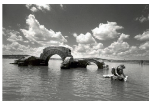
Ruínas Atuais da Igreja Velha no Açude do Cocorobó.

A Guerra de Canudos nos convida a ver a cidade devastada, mas também a enxergar os fantasmas das diversas Canudos ressurgidas, duplicadas e replicadas nas cidades-favelas contemporâneas, ativando memórias épicas, líricas e trágicas do discurso da urbanização brasileira na hipérbole da imagem catastrófica de Os sertões , como anti-modelo da nacionalidade moderna, que é contraposta com a imagem da alteridade nacional destrocada. Ao perspectivar da cidadela sertaneja pelo dilaceramento da falta e da ausência, as imagens canudianas continuam atormentar as cidades atuais com seus enclaves de comunidades perdedoras, mas que são, ao mesmo tempo, os modelos diferentes de existência que resistem.