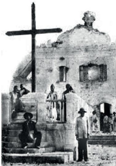
Ruínas da Igreja Velha do Belo Monte.

O fantasma canadiano das edificações populares se infiltra no imaginário contemporâneo de cidades de todos os portes no Brasil. Elas são engendradas em suas arquiteturas modernas pelos aspectos rurais canadianos, contrapondo ao modelo da ordem e do progresso republicanos o anti- modelo arquitetônico excluído do ordenamento oficial. O mapeamento contemporâneo representa esta realidade numa relação ao mesmo tempo diacrônica e sincrônica de temporalidade, aproximando espaços que foram contrapostos, pois são eles que formam o imaginário urbano nacional. Antonio Risério, em Cidade no Brasil , abre o capítulo denominado Sertão, Cidade, Segregação com uma afirmação que explicita este contraponto na história da formação da cidade brasileira. Segundo ele: