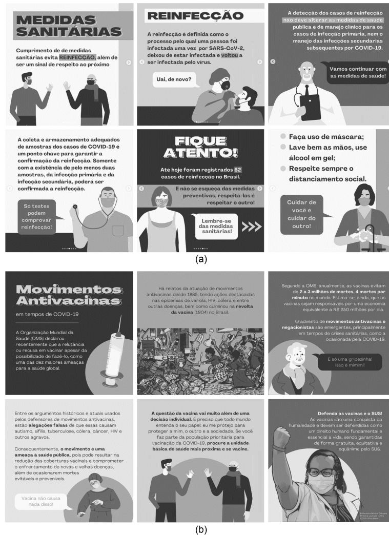
Figura 3 – Apresentação de flyers

tenha repetido orientações que foram amplamente difundidas no início da pandemia (uso de máscara, lavagem das mãos, uso de álcool em gel, manutenção de distância física das demais pessoas quando em ambiente coletivos, entre outros), ele foi o que registrou maior número de impressões ao longo dos doze meses do projeto (Fig. 3a).