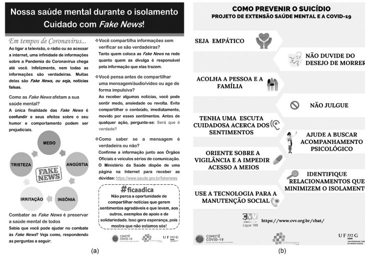
Figura 2 – Apresentação de flyers

de higiene) e com questões que preocupavam as autoridades do país e do mundo relacionadas aos desafios enfrentados para que a informação científica acerca da Covid-19 pudesse chegar de maneira adequada à população, combatendo as Fake News (Fig. 2a).