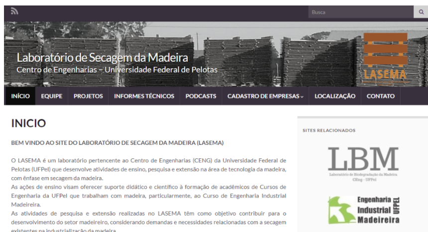
Figura 1 - Site do Laboratório de Secagem da Madeira (LASEMA) reestruturado para abrigar os materiais digitais (informes técnicos e podcast ) produzidos

A figura 1 ilustra o site do Laboratório de Secagem da Madeira (LASEMA) da UFPel reestruturado para divulgar e abrigar os materiais digitais produzidos. O site está vinculado ao Portal da UFPel com o seguinte endereço: https://wp.ufpel.edu.br/lasema/