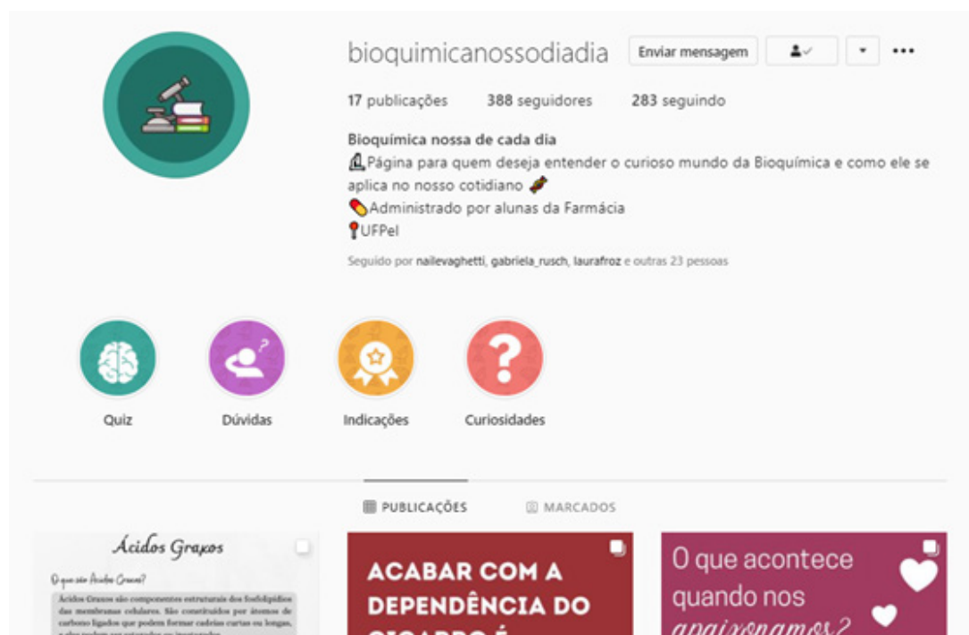
Figura 2 - Print do perfil no Instagram do Bioquímica Nossa de Cada Dia.