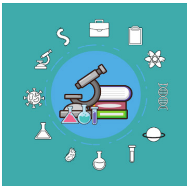
Figura 1 - Logotipo do Projeto Bioquímica Nossa de Cada Dia.