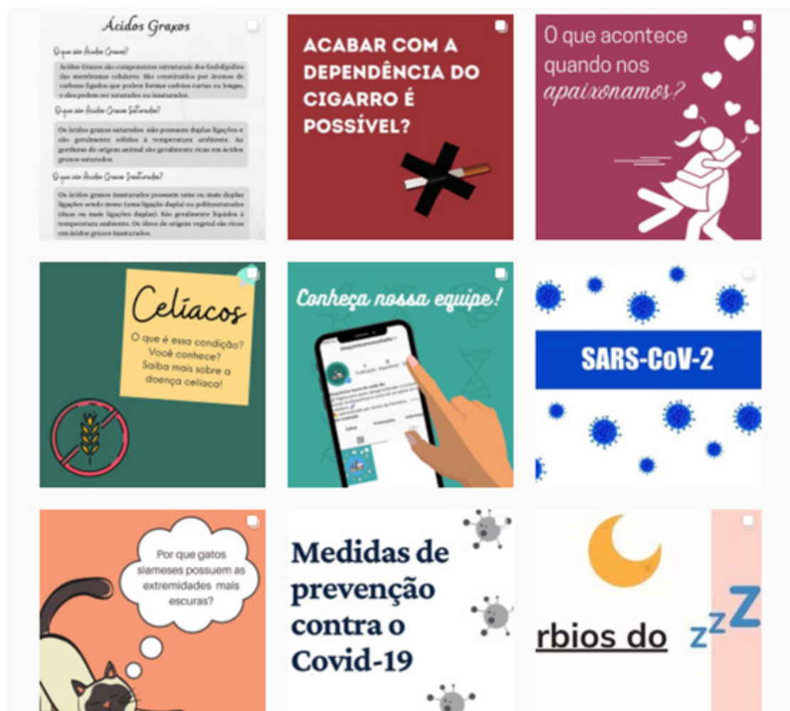
Figura 3 - Exemplos de conteúdos abordados no perfil do Instagram do Bioquímica Nossa de Cada Dia.