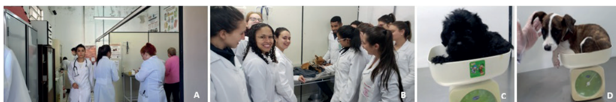
Figura 2 - Atuação dos profissionais veterinários no ambulatório Ceval, em 2019. (A) Estrutura do ambulatório após dez anos de implantação do projeto de extensão, com mesa de inox para exames físicos e procedimentos aos pacientes e salas de atendimento com divisórias. (B) Atendimento clínico veterinário com a participação de discentes da disciplina de Terapêutica aplicada a um canino pós-parto. (C e D) Animais em atendimento pediátrico profilático, conquista da atuação dos dez anos do projeto quanto à conscientização dos tutores.