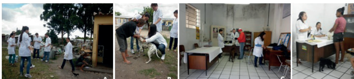
Figura 1 - Atuação dos profissionais veterinários na comunidade Loteamento Ceval e no Ambulatório, em 2009, no início do projeto de extensão. (A e B) Discentes e docentes do curso de Medicina Veterinária da UFPel atuando in loco na comunidade do Ceval; (C e D) Atendimentos no ambulatório Ceval aos animais da comunidade, no ano de início do projeto, demonstrando a estrutura dos ambulatórios.

Em resposta à carência de atendimento a esses animais, ao interesse da população, à preocupação com a saúde pública e ao compromisso com a formação de profissionais que desenvolvam, ao longo da vida acadêmica, o papel de cidadãos, foi elaborado o projeto que visa assistir aos animais de famílias em situação de vulnerabilidade social. Os atendimentos, restritos às famílias cadastradas, as quais passam por entrevista com assistente social e apresentam documentos que comprovam sua renda, são realizados duas vezes por semana, às terças e quintas-feiras, das 8h às 12h e são destinados à clínica médica de pequenos animais. Animais de grande porte são também assistidos, mas por outros projetos concomitantes. Nesses dias são distribuídas dez fichas, por ordem de chegada dos pacientes. As consultas são realizadas por médicos veterinários, pós-graduandos, graduados e professores do curso de Medicina Veterinária da UFPel (Fig. 1 e 2).