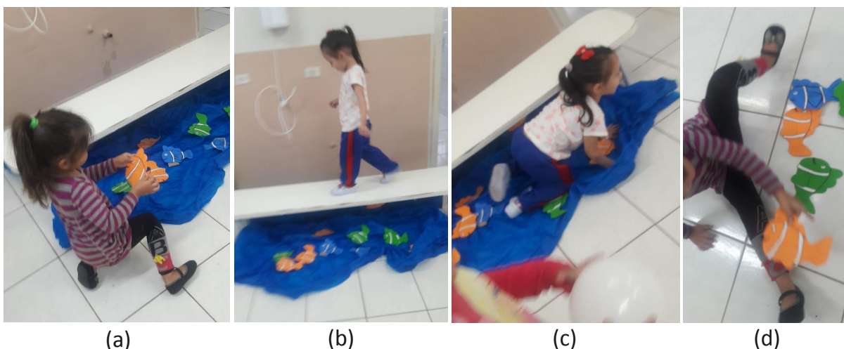
Figura 5 - Crianças brincando durante a intervenção no “Rio”: Pescando (a), se equilibrando no banco / ponte (b), nadando no “Rio” (c) e cozinhando os peixes (d)

Outro brinquedo onde foi nítida esta relação foi com o “Rio” (Fig. 5), montado com o banco como ponte e o TNT azul em baixo simulando a água e os peixes EVA, onde além de se equilibrar sobre o banco, também brincaram de pular na água (tecido), de nadar, de pescar e cozinhar os peixes. Por meio deste, foi possível problematizar questões com relação à conservação da natureza, falando sobre a necessidade de jogar lixo nos locais apropriados citando as consequências de não efetuar este ato, instigando eles a pensar o que aconteceria com o rio e com os peixes que ali estavam.