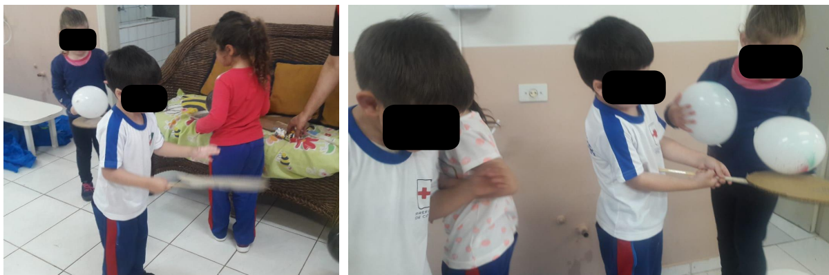
Figura 4 - Crianças brincando em conjunto com os colegas durante a intervenção, utilizando as raquetes de material reciclável e as bexigas

Com as bexigas e raquetes (Fig. 4) as crianças jogaram muito em conjunto, se socializando e também desenvolvendo as habilidades motoras trazendo estes aspectos.