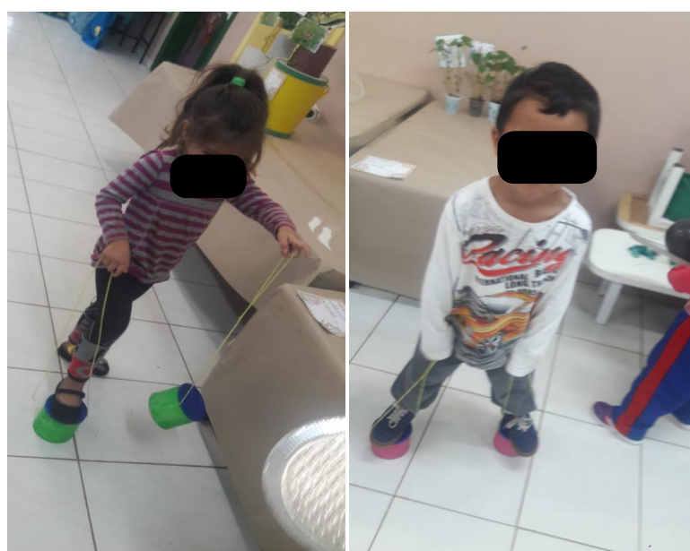
Figura 3 - Crianças brincando durante a intervenção utilizando os pés de lata

Por meio destas brincadeiras foi possível potencializar questões a estas áreas de conhecimento, como nos pés de lata (Fig. 3), onde além de desenvolver o equilíbrio e a coordenação motora ocorreram situações de auxílio entre as próprias crianças para se equilibrar sobre o brinquedo, o que demonstrou a potencialização de valores e virtudes, trazendo o ideal de se preocupar não apenas consigo, mas também com o outro, o qual é um dos aspectos da Educação Ambiental.