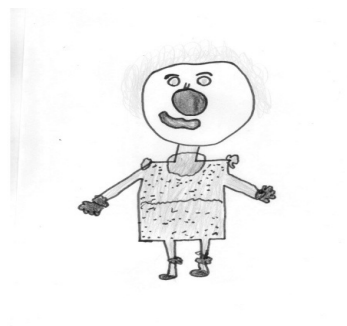
Figura 4 – Desenho pós atividades. A criança relata por meio do desenho o personagem palhaço, o qual a deixou feliz.

A equipe que presta cuidados às crianças durante grande parte do seu plantão, relatou que as crianças internadas apresentam: “Medo de pessoas vestidas de branco”; “Medo da punção na veia”; “ficam tristes”; “relatam dor”; “ficam carentes, pois existem mães que se tornam agressivas com as crianças”.