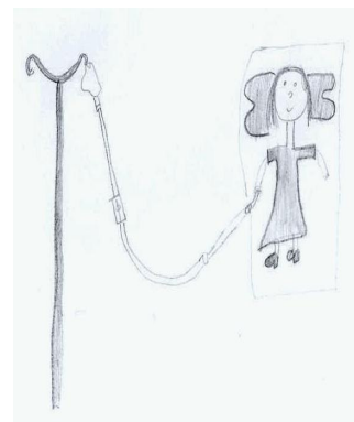
Figura 2 – Desenho pré atividades. A criança relata por meio do desenho situação exposta durante a internação (criança com soro e equipo).