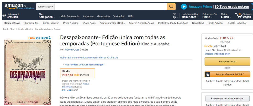
FIGURA VI – E-book volume único de DSPXNT