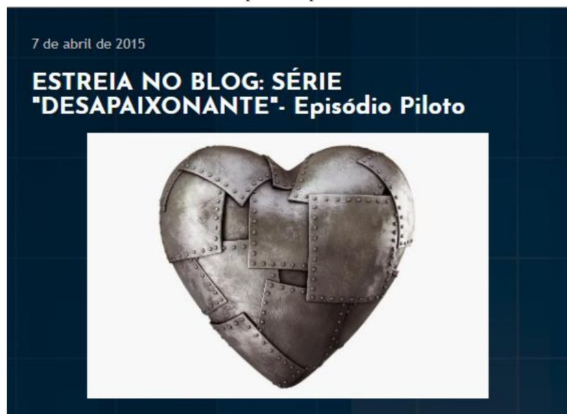
FIGURA I - Episódio piloto de DSPXNT

elo para a manutenção cativa de audiência. Todavia, existem várias outras fórmulas para suprir a interatividade e a participação do leitor, bem como consolidar a narrativa através de divulgação massiva. Marvin perscruta o ciberespaço à procura de uma oportunidade de tornar DSPXNT acessível a todos. A primeira temporada foi inicialmente postada na íntegra no blog de Marvin, em seguida no aplicativo Wattpad 3 , para depois se transformar em e-book 4 (vendido no site da Amazon, onde já se encontram disponíveis todas as quatro temporadas completas) e por fim em livro físico, com o selo da Editora Skull. Os exemplares da tiragem de estreia já foram esgotados 5 , o contrato para lançamento da segunda temporada impressa foi assinado, e a Skull dará continuidade à publicação da websérie-folhetim.