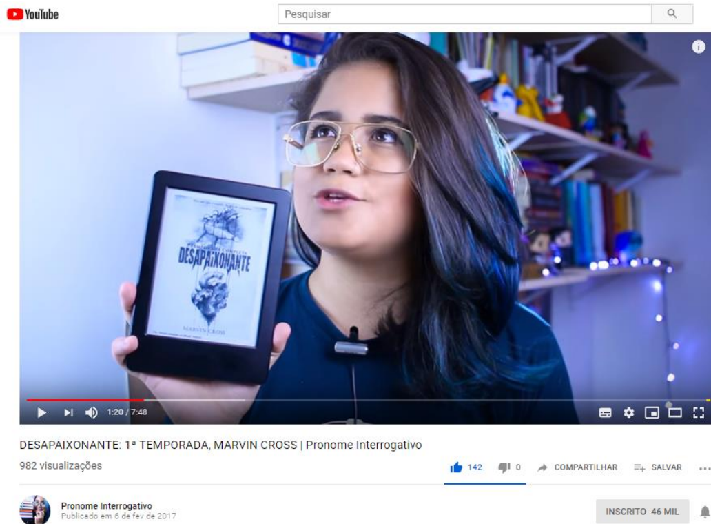
FIGURA IV - Resenhas de DSPXNT em canais especializados