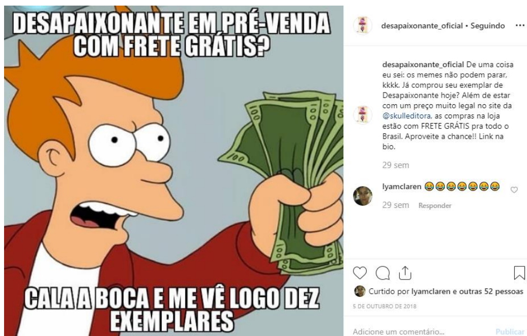
FIGURA V - Memes de DSPXNT

Para otimizar os resultados e interagir melhor com o público, o autor criou contas em redes sociais, como Instagram (@desapaixonante_oficial) e uma fanpage no Facebook, em que o autor elabora memes e conteúdos humorísticos e criativos para engajamento dos seguidores.