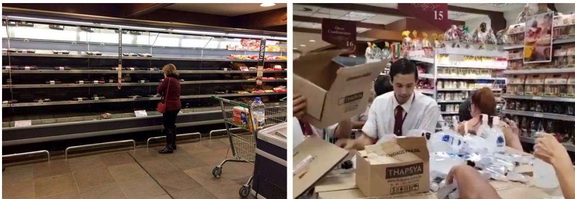
Figura 04 esq: Supermercado em Porto Alegre com as Prateleiras Vazias. 2018. 1 fotografia. | Figura 04 dir: Aglomeração de clientes durante chegada de álcool gel em supermercado de Porto Alegre. 2020. 1 quadro de vídeo.

O imaginário é quase o simbólico, mas ao invés de tratar da estrutura (leis e regras), ele trabalha com as sensações e memórias (visão, audição, olfato, tato ou gosto). É contando com esta afetividade que alguns olham e ouvem de forma estupefata, outros com a incredulidade, para as manchetes e notícias vinculadas sobre o avanço da epidemia pelo país. Para os que a aceitam como fato, e podem colocar-se em redomas de proteção, ela existe e ameaça a urgência pela retomada da democracia no Brasil. Para os que a negam, a redoma é uma imposição falsa que serve apenas para impedir o avanço da democracia no Brasil. Dessa forma, pode-se admitir que a doença transita como ameaça, tanto como a aceitação ou negação dela também o seja