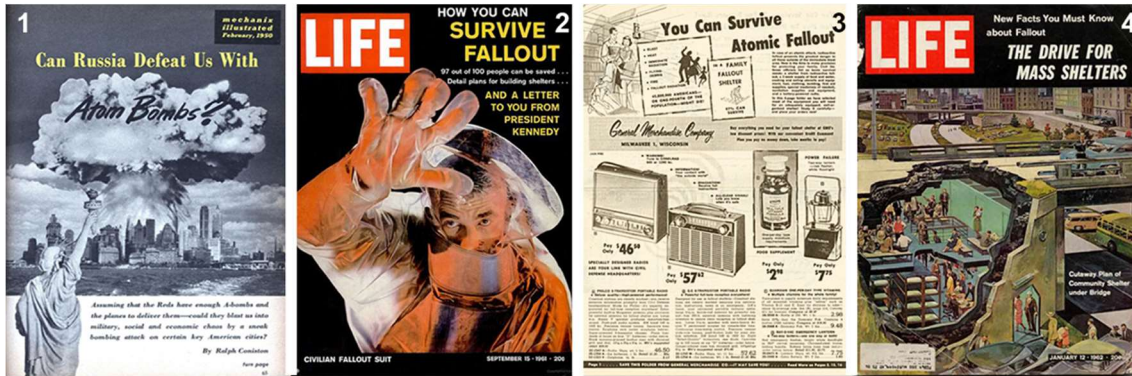
Figura 02-1: Mechanix Illustrated. Can Russia Defeat Us With Atom Bombs? (Pode a Rússia derrotar-nos com bombas atômicas?). Pág 65. 1950. 1 fotomontagem. | Figura 02-2: Life. How You Can Survive Fallout. (Como você pode sobreviver à radiação). Capa. 1961. 1 fotografia. | Figura 02-3: General Merchandise Co. You Can Survive Atomic Fallout (Você pode sobreviver à radiação atômica). Sem/data. 1 ilustração. | Figura 02-4: Life. The Drive for Mass Shelters (As orientações para abrigos para as massas. Capa. 1962. 1 ilustração.

A própria revista Life publicara uma longa matéria sobre o assunto em setembro de 1961. Logo na abertura, um chamamento do presidente Kennedy incentivando seus cidadãos que instalassem esses abrigos. Lembrando que em abril daquele ano, os Estados Unidos tiveram frustrada a invasão patrocinada de Cuba – o episódio da Baía dos Porcos – e, em 1962, envolveram-se na Crise dos Mísseis com a União Soviética como consequência disso.