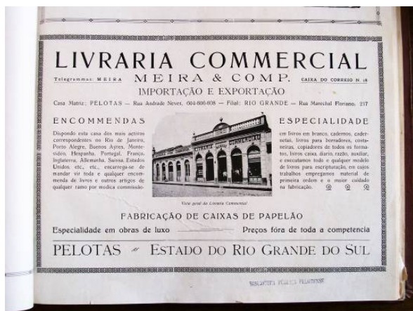
Figura 3 – Anúncio da Livraria Commercial no Álbum de Pelotas 1922. Equilíbrio compositivo demonstrado pela divisão do texto em duas colunas com a foto da fachada do estabelecimento ao centro.