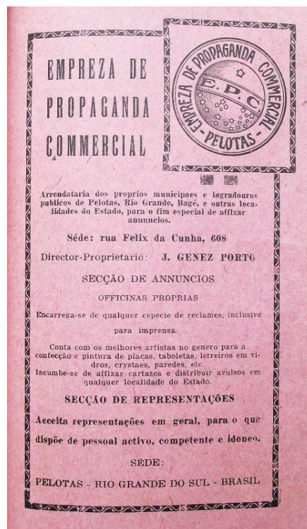
Figura 8 – Anúncio da Empresa de Propaganda Commercial no Almanach de Pelotas 1928, p. IX.

Equilíbrio compositivo demonstrado pela divisão do texto em duas colunas com a foto da fachada do estabelecimento ao centro.