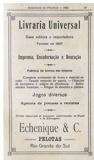
Figura 1 – Anúncio da Livraria Universal no Álbum de Pelotas 1922.

Destaque para o imenso texto dividido em duas colunas e ornado com a foto da fachada da livraria.