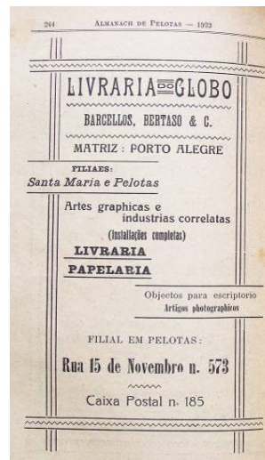
Figura 6 – Anúncio da Livraria do Globo no Almanach de Pelotas 1923, p 244.