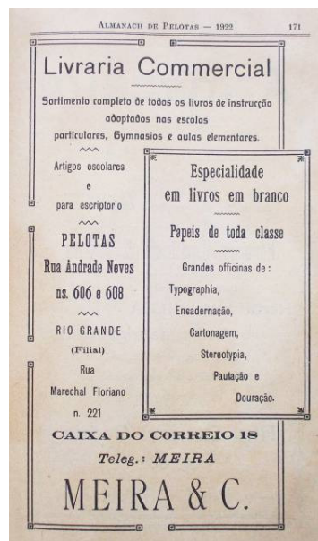
Figura 4 – Anúncio da Livraria Commercial no Almanach de Pelotas 1922, p. 171. Destaque para o efeito de sobreposição de caixas obtido com filetes.