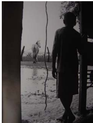
Figura 5 - Invierno en la quesera, Bajo Apure, 2008.

Todas as perspectivas apresentadas nos expressam que as fotografias não são meros cortes lineais no tempo, elas podem nos situar na atualidade, mas também no passado, pois vão mudando com nossa própria vida.