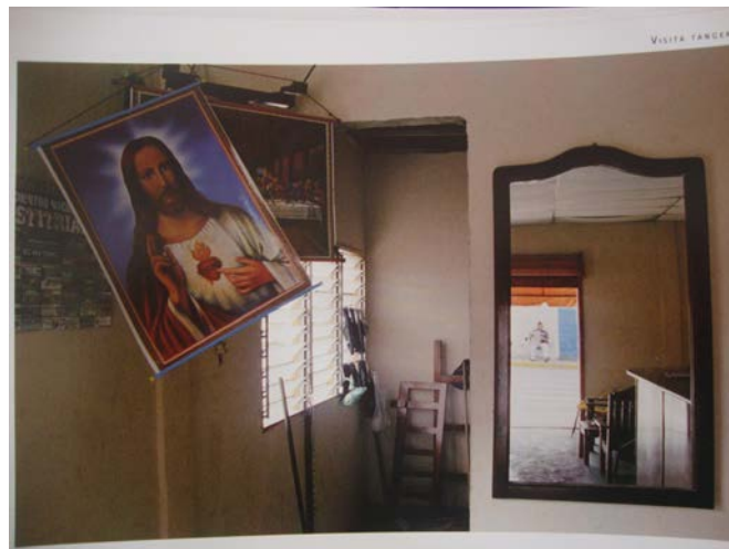
Figura 4- Visita tangencial, estado Apure, 2007.