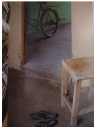
Figura 2 - Siesta en Elorza, estado Apure, 2008.

Em Siesta en Elorza , Benavides revela a possibilidade da presença humana colocando no primeiro plano duas rastreiras frente a uma cadeira que se assoma à direita; com certeza alguém esteve ali, trás a porta aberta vislumbra-se uma bicicleta, o que demonstra mais uma vez, a presença humana, embora em um caso imediato possa ser interpretada como a sua ausência dentro de um ambiente limpo, sem lixo. Esta imagem, então, torna-se uma pintura, um óleo de traços desenhados pelo artista que deseja fixar o tempo nela. Efetivamente, o tempo fica detido no silêncio das rastreiras sem pés do primeiro plano, construindo uma experiência temporal que apresenta um passado que já passou associado com um sentimento de falta, uma espécie de morte (SERÉN, 2002)