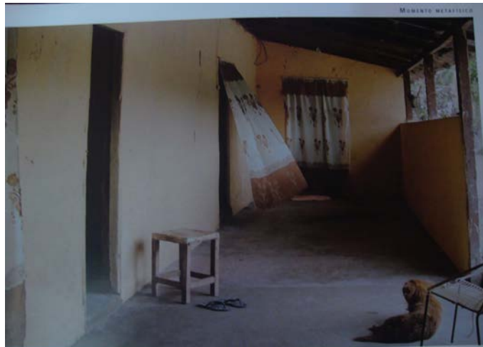
Figura 3 - Momento metafísico, estado Apure 2008.

uma cadeira de couro olha a cortina em movimento, a luz entra pela porta aberta que está frente à outra porta aberta, e nós, observadores, estamos do interior junto ao fotógrafo que está do lado de dentro fotografando a interior. Assim, essa luz que nos indica que a fotografia foi tirada de dia, junto com “a sensação de que a perspectiva é uma questão não só de espaço, como também de tempo” (DYER, 2008, p.231) parece convida-nos ficar sentados no banco vazio esperando a alguém que desconhecemos.