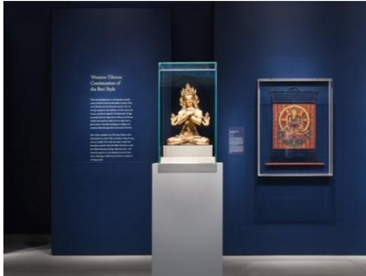
Figura 7 – Obra em destaque no Rubin Museum of Art, Nova York, EUA.