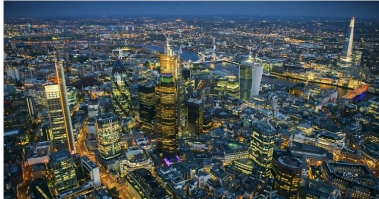
Figura 9 – Ensaio do fotógrafo Jason Hawkes para a BBC.