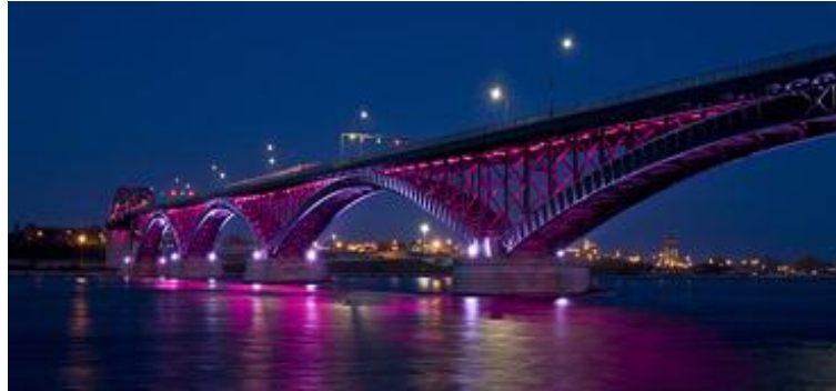
Figura 10 – Ponte entre Buffalo, Estados Unidos da América e Fort Erie, Canadá.