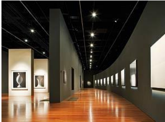
Figura 3 – Percurso no Young Museum em San Francisco, Califórnia, EUA. Projeto de Iluminação de Hiroshi Sugimoto e fotografia de David Wakely.

Fonte: Architectural Record ( http://archrecord.construction.com/projects/lighting/archives/0802sugimoto-1 )