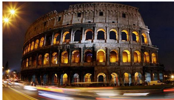
Figura 13 – Fachada do Coliseu, Itália. Iluminação amarelada evidencia características arquitetônicas, volumes e materialidade.