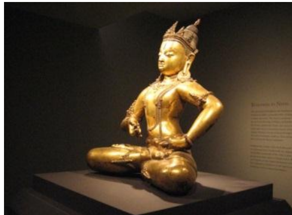
Figuras 14 – Obra tridimensional iluminada no Rubin Museum of Art, Nova York, Estados Unidos da América.