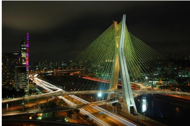
Figura 1 – Ponte Octávio Frias de Oliveira, em São Paulo, Brasil.