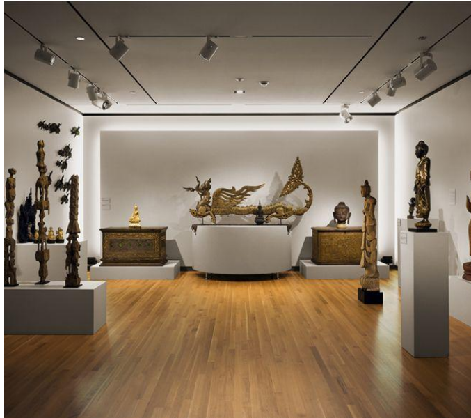
Figura 8 – Loyola University Museum of Art, Chicago, Estados Unidos da América.