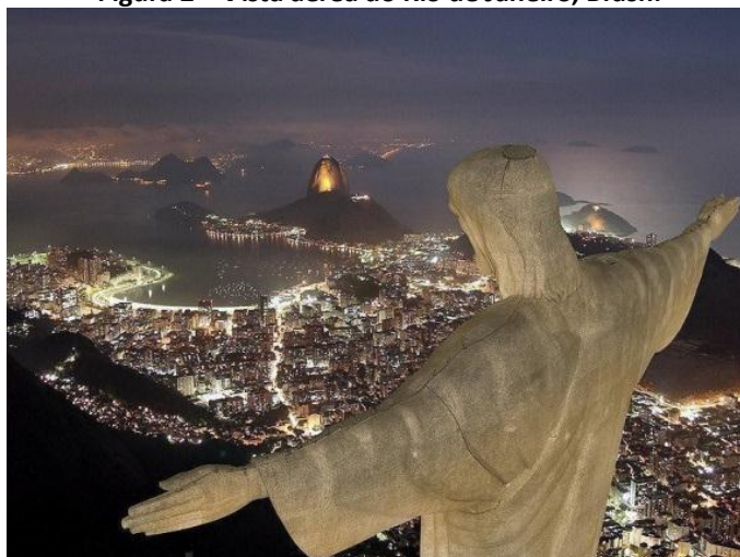
Figura 2 – Vista aérea do Rio de Janeiro, Brasil.