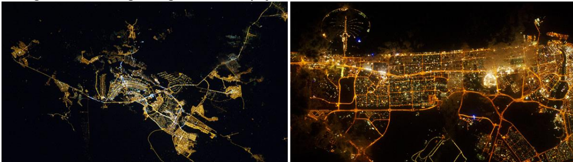
Figuras 4 e 5 – Imagens registradas do espaço: Brasília, Brasil e Dubai, Emirados Árabes Unidos.