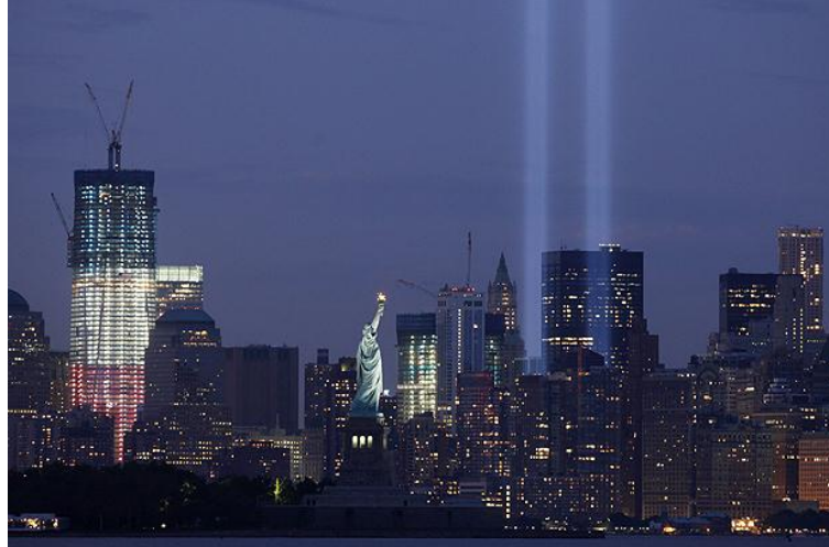
Figura 6 – Iluminação de destaque em obras urbanas em Nova York, EUA.