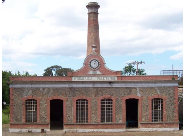
Figura 2 - Casa de Máquinas da represa do Moreira