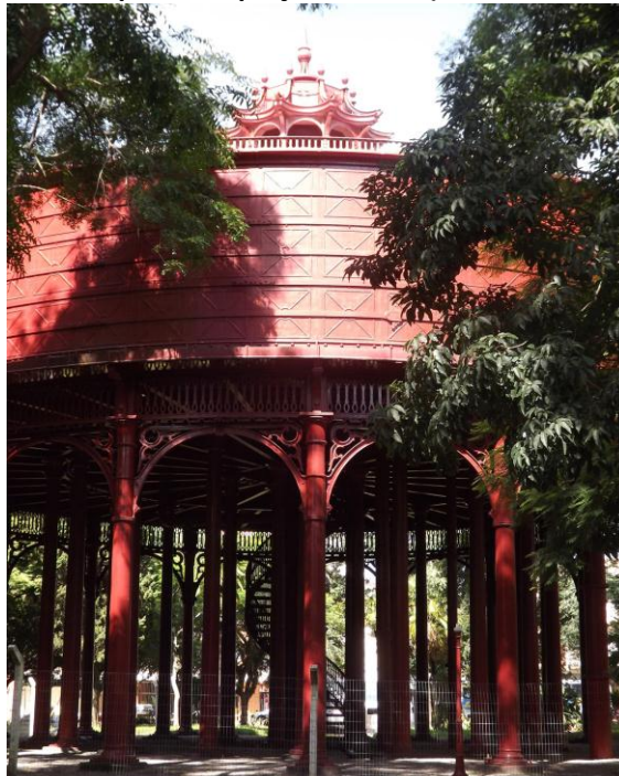
Figura 1 - Torre do Depósito da praça Caridade (atual Piratinino de Almeida)

A redução da capacidade de armazenamento de água na área urbana pode ter sido um dos motivos que ocasionou as diversas críticas à Companhia Hidráulica Pelotense quanto aos problemas de abastecimento d'água em Pelotas.