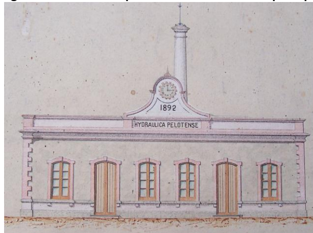
Figura 3 - Casa de Máquinas e Oficinas. Fachada principal