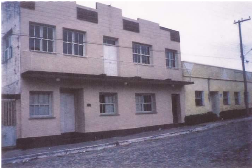
Figura 02: Fachada do Clube Guarani - final da década de 1990.