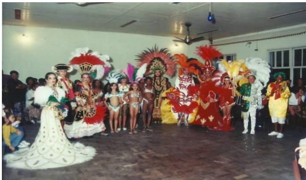
Figura 08: Desfile de Fantasias do Clube Guarani, 1995.