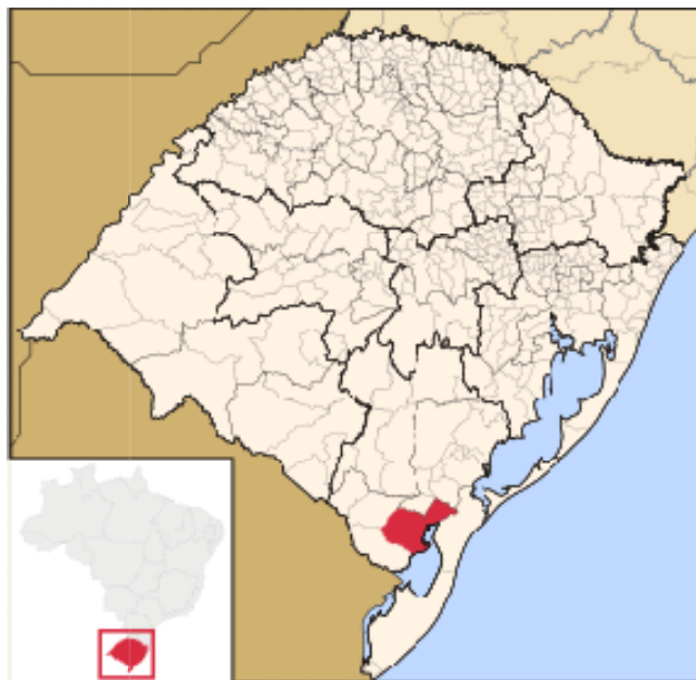
Figura 01: Mapa do Rio Grande do Sul, em vermelho o município de Arroio Grande.

Em 1858, conforme Quadrado (2012), a cidade de Arroio Grande tinha cerca de 4.000 habitantes. Dentre esses, conforme a autora, quase a metade eram africanos e seus descendentes, e que passadas décadas pós-abolição o racismo permeia o lugar. Um exemplo disso é a proibição da presença dos negros dos espaços sociais da cidade, em especial em clubes sociais, como o Clube Caixeiral, Clube do Comércio e o Centro Tradicionalista Gaúcho (CTG) até há poucas décadas atrás. Estes clubes só recebiam negros em suas sedes na condição de trabalhadores, para prestação de serviços, conforme destacado por Kosby (2011). Um exemplo é a Banda Farroupilha, composta por homens negros, que animavam as festas de não negros, principalmente em períodos carnavalescos. A autora ainda destaca que, devido à exclusão dos negros dos clubes sociais, o espaço que restava para festejar eram as ruas ou nas casas uns dos outros.