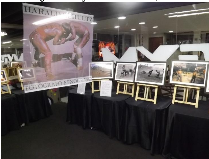
Figura 8: Fotografias.