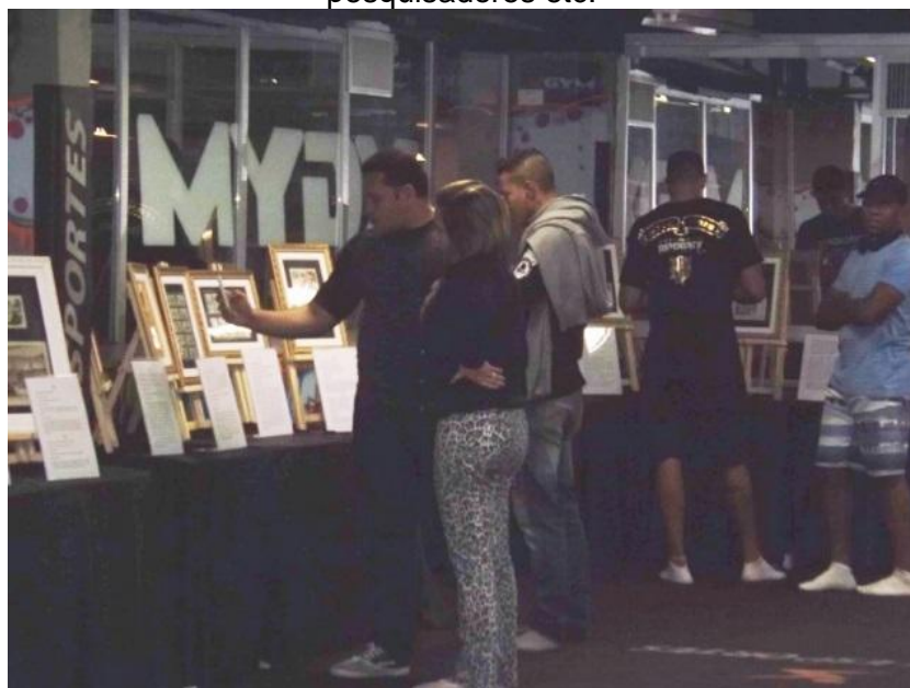
Figura 1: Público diversificado visitou a exposição, composto de atletas, interessados em geral, pesquisadores etc.

Com entrada gratuita, ressalta-se que o público visitante foi diversificado (Figura 1). Abrangeu interessados em geral, atletas, praticantes, treinadores, mestres, professores, estudantes e profissionais de História, Educação Física, Medicina, Psicologia, Pedagogia etc. O local escolhido foi franqueado, sem ônus, pelo proprietário de uma grande academia de artes marciais em que, à época, circulavam atletas profissionais de Mixed Martial Arts – MMA.