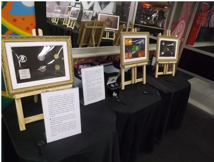
Figura 7: Numismática.