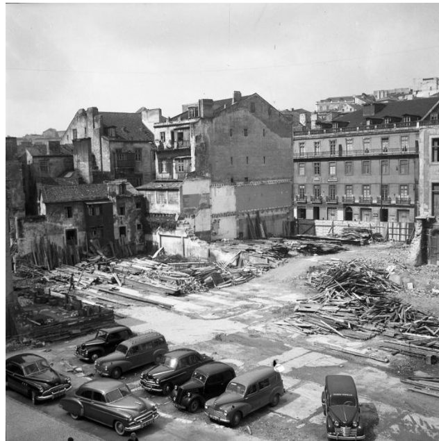
Figura 4. Demolições na Mouraria. Fotografia de Benoiel, Judah, 1900 – 1968. © Arquivo Fotográfico de Lisboa, 2020 (AML – T/AMLSB/CMLSBAH/PCSP/004/JBN/004426).

Já em democracia, cresceu a pressão popular das comissões de moradores, que pugnam pela preservação e manutenção dos edifícios e espaços públicos. Neste contexto, a partir de 1985, os bairros históricos passaram a desenvolver programas de conservação, reabilitação e de requalificação, através de gabinetes técnicos autárquico. O Gabinete Técnico da Mouraria assumiu como missão a intervenção nos edifícios com maiores riscos de segurança, a fim de travar a sua degradação (AMARO, 1998: 62). Os trabalhos de conservação envolveram sobretudo o edificado pré-pombalino, de acordo com um regime integrado que abrangia o tecido social e económico, procurando incrementar a função habitacional.