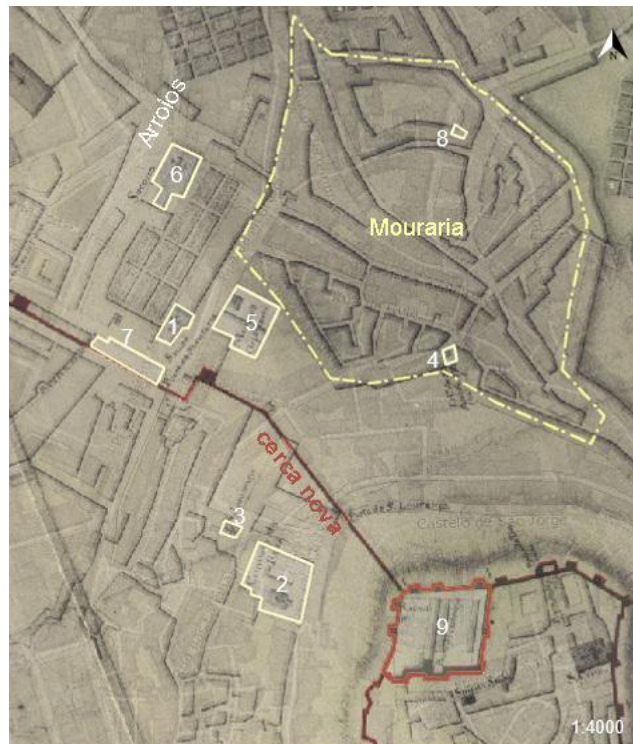
Figura 2. Construções dos séculos XVI e XVII na Mouraria, com base na cartografia de Guilherme de Menezes, 1761, consultada em Lx Interativa, 2020. 1 – Capela de São Sebastião (Nossa Senhora da Saúde); 2 – Convento de Nossa Senhora da Rosa; 3 – Igreja de São Lourenço; 4 – Colégio de Santo Antão-o-Velho; 5 – Colégio dos Meninos Órfãos; 6 – Igreja de Nossa Senhora do Socorro; 7 – Palácio do Marquês do Alegrete; 8 – Capela das Olarias ou do Senhor Jesus da Boa Sorte; 9 – Castelo de São Jorge.

Em meados de Quinhentos o bairro foi confrontado com um bloqueio, causado pelo crescimento demográfico e falta de espaço para mais construções, espalhando-se ao longo do século XVII pelo vale de Arroios até à base da colina de Santana (a atual zona do Martim Moniz). A construção de novos edifícios nobres e religiosos veio dar uma nova estrutura a este espaço. Porém, com os danos causados pelo terramoto de 1755, muitos destas edificações de referência acabaram por adotar novas funções, em vez de serem integradas no novo plano urbano. Se após a catástrofe uma parte da cidade renasceu rapidamente com inspiração iluminista, outra permaneceu numa certa medievalidade, em crescente degradação e continuado crescimento populacional. Com efeito, a Mouraria manteve quase inteiramente a estrutura urbana prévia, como se atesta na cartografia antiga. Afluiu aqui um grande contingente migratório popular proveniente de áreas rurais do país, impulsionando a degradação das condições de vida. Este processo iniciou um período particular de segregação social do bairro (FRANÇA, 1980: 50; MENEZES, 2004: 51; RODRIGUES, 1997: 59).