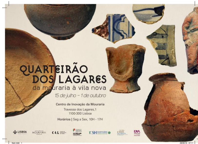
Figura 8. Cartaz da exposição «Quarteirão dos Lagares: da Mouraria à Vila Nova», da autoria de Ana Filipa Leite, onde se figuram, entre outras, as tradicionais peças de barro vermelho produzidas neste bairro nos finais da Idade Média.