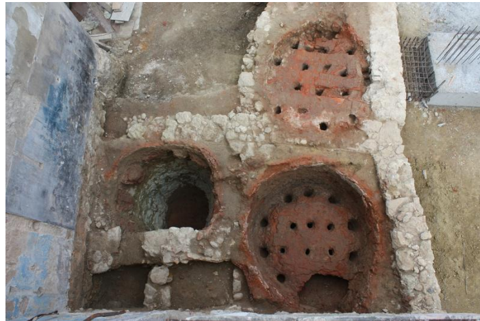
Figura 6. Fornos cerâmicos encontrados no Largo das Olarias, nº19-23, e Travessa do Jordão, nº1-15. Fotografia de Anabela Castro, publicada em CASTRO et al. , 2017.