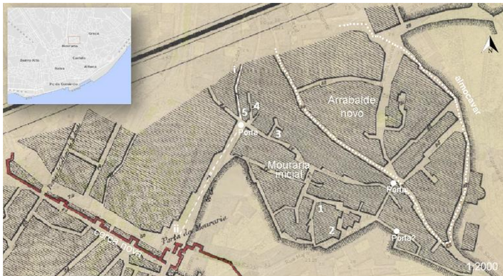
Figura 1. Mouraria de Lisboa nos séculos XIV e XV. Adaptação de OLIVEIRA e VIANA, 1993 (pág. 194), sobre cartografia de João Nunes Tinoco, 1650, consultada em Lx Interativa, 2020. 1 – Mesquita Grande; 2 – Madraça; 3 – Açougue; 4 – Mesquita Pequena; 5 – Banhos públicos; 6 – Almocávar; i – Rua de Benfica da Mouraria (atual Rua do Benfornoso); ii – Rua da Mouraria.

Do polo comercial destacava-se a atual Rua do Benfornoso, então Rua de Benfica da Mouraria, no exterior da referida porta. Esta zona foi perdendo continuamente o seu caráter periurbano, integrando-se na malha da cidade como área artesanal, com especial vocação para a produção cerâmica (BARROS, 1998: 31). A importância das manufaturas, que ocupavam mais de 80% dos moradores, impulsionou a expansão do bairro para fora dos seus limites originais. Ao longo do século XIV, com o aumento da população islâmica proveniente de outras partes de Portugal, e com o contributo de muitos artesãos cristãos que se mudaram para esta zona, desenvolveu-se um novo núcleo, o chamado arrabalde novo, na vertente oposta do mesmo vale (fig. 1). Aqui coabitavam oficinas de oleiros, tapeteiros, esparteiros e outros, além de lagares de azeite. No século XV este novo núcleo foi-se ligando ao mais antigo, totalizando uma área de cerca de cinco hectares (BARROS, 1998: 90 e 144; MARQUES, 1988: 103). O bairro permaneceu ao longo da Baixa Idade Média no exterior dos limites físicos de Lisboa, pois se a cerca nova de 1373-1375 abarcou os focos populacionais da cidade que se tinham criado fora da cerca velha islâmica nos séculos anteriores, continuou a excluir a Mouraria. A ela se acedia pela Porta de São Vicente ou da Mouraria, que conduzia à Rua da Mouraria e, depois, à Rua de Benfica; foi nesta porta que, sugestivamente, se fixou a epígrafe evocativa da construção desta nova muralha (SILVA, 1948: 42-48).