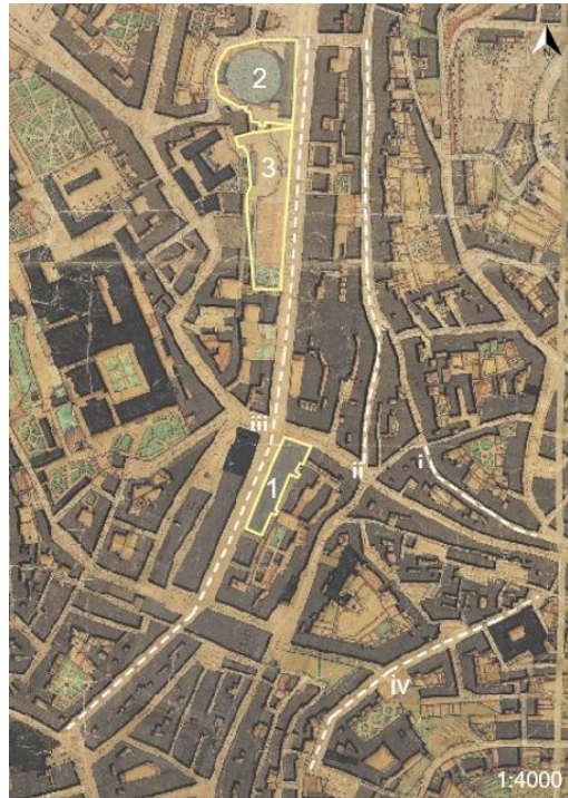
Figura 3. Principais intervenções urbanas da segunda metade do século XIX na Mouraria, a partir da cartografia de Silva Pinto, 1911, consultada em Lx Interativa, 2020. 1 – Teatro do Príncipe Real (Teatro Apolo); 2 – Real Colyseu de Lisboa; 3 – Paraíso de Lisboa; i – Rua do Terreirinho; ii – Rua do Benfornoso; iii – Prolongamento da Rua Nova da Palma; iv – Rua Marquês Ponte de Lima.

Os problemas de circulação e insalubridade da Mouraria foram tratados de forma radical a partir de 1937, nos primeiros anos do Estado Novo. Procedeu-se à demolição de muitos edifícios em mau estado, incluindo alguns de valor histórico (fig. 4). Destacam-se o palácio do Marquês de Alegrete, toda a Travessa da Palma, a igreja do Socorro, o Teatro Apolo e todo o lado ocidental da Rua da Mouraria, onde apenas sobrou a capela de Nossa Senhora da Saúde. Só a parte da alta do bairro foi poupada, “um dos restos piedosos da velha Lisboa” (ALMEIDA, 2016: 125), abrindo-se na zona baixa uma grande praça, o atual Largo Martim Moniz, ladeada por novos edifícios, como o Hotel Mundial, que deveriam servir como arquétipo da modernização que ali se pretendia realizar. A verdade é que esta nova praça não se chegou a consolidar, permanecendo até hoje como uma ferida urbanística, mercê dos sucessivos projetos fracassados para lhe conferir melhor enquadramento, através do tratamento do espaço público (VENDA, FONSECA, 2011: 62).