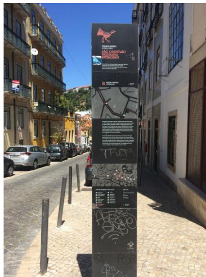
Figura 7. Totem na Rua Marquês de Ponte de Lima, entre a igreja de São Lourenço e o antigo colégio de Santo Antão-o-Velho.

de reabilitação urbana coordenado pela Câmara Municipal de Lisboa, com um valor global de 7,5 milhões de euros (parte financiado pela União Europeia), além de ter implicado a requalificação do espaço público, visou também a valorização turístico-cultural do bairro 4 . Entre as suas ações merece menção a criação de um equipamento turístico-cultural ligado ao fado na Casa da Severa (homenagem a Maria Severa Onofriana, fadista afamada e mulher de má vida aqui falecida em 1846), que implicou as escavações acima referidas, e o restauro de um troço da cerca baixo-medieval da cidade, além da reabilitação da igreja de São Lourenço 5 , que, contudo, permanece encerrada ao público. Em 2014 foi inaugurado um percurso assinalado por totens, que visou promover a visita deste espaço (fig. 7) 6 , não se incluindo, porém, nenhum sítio arqueológico, ou espaços relacionados com as temáticas acima citadas. A este propósito refira-se que, dos escassos oito sítios com interesse arqueológico em Lisboa nos finais do século XX, nenhum deles se localizava na Mouraria (SILVA, GUINOTE, 1998: 179-92). Década e meia depois existiam já 22 janelas arqueológicas visitáveis na cidade, mas nenhuma neste bairro (BUGALHÃO, 2016: 469-70).