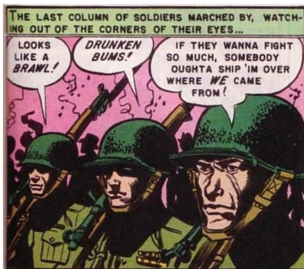
Figura 4. O soldado reflete sobre a melhor forma de empregar a violência dos cidadãos.

Na página anterior, um dos soldados do desfile, vendo a confusão, ironicamente diz: “Se eles querem tanto lutar, alguém deveria mandá-los pro lugar de onde voltamos” 21 (figura 4).