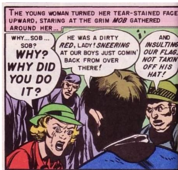
Figura 3. Os agressores justificam sua ação violenta para a esposa da vítima.

A história em quadrinhos The Patriots discute essas articulações, entre externo e interno, ao colocar o contexto da parada em que os personagens assistem, na comemoração do retorno de soldados da Guerra da Coreia. Uma guerra da qual os personagens apoiam e de certa forma se orgulham, uma guerra contra o inimigo externo, o comunismo na península da Coreia. Quando os homens se voltam contra o alegado comunista e conseqüentemente o assassinam, eles entendem sua ação como o combate à “ameaça doméstica” e assim a justificam. Quando a esposa vê o marido morto, caído na calçada em meio à multidão, e pergunta o porquê de eles terem feito aquilo, um dos homens responde: “Ele era um vermelho sujo, moça! Estava desdenhando de nossos garotos que voltaram de lá!” 20 (figura 3). A fala do personagem deixa claro que os comunistas não merecem nenhum tipo de piedade; e a única forma de lidar com essa “ameaça” é de forma violenta e definitiva.