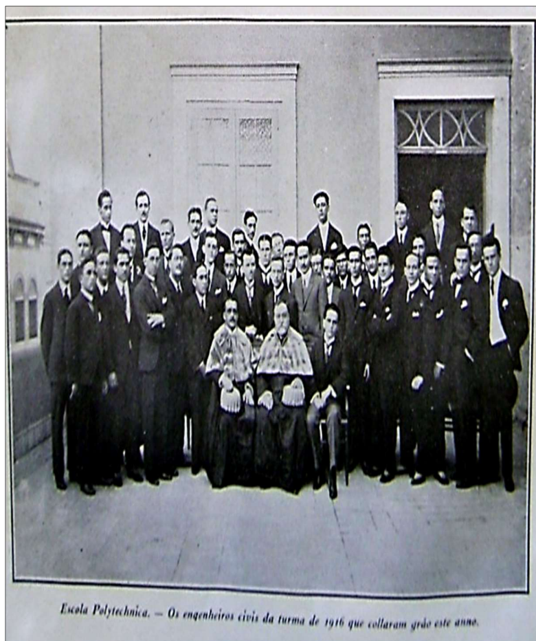
Imagem 04: “Escola Polytechnica” (Os engenheiros civis de 1916).

Outra referência dos papéis das mulheres, no período e contexto, diz respeito à participação delas na Guerra. Na proposta de análise da relação das mulheres com o confronto, também se percebe aspectos do silenciamento histórico feminino, caracterizado pela ausência de participação delas nos discursos e definições do conflito.