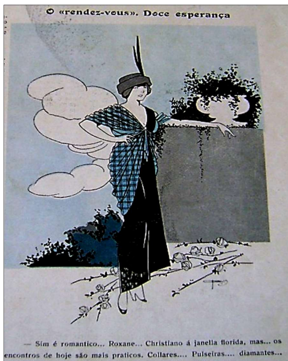
Imagem 06: “O ‘rendez-vous’. Doce esperança”. Fonte: Careta (07/03/1914, p. 21). Ilustrador: J. Carlos.

ruas. Vale lembrar que isso implica na mobilidade do cotidiano, por uma demanda das mulheres nos postos de trabalho, em consequência da guerra.