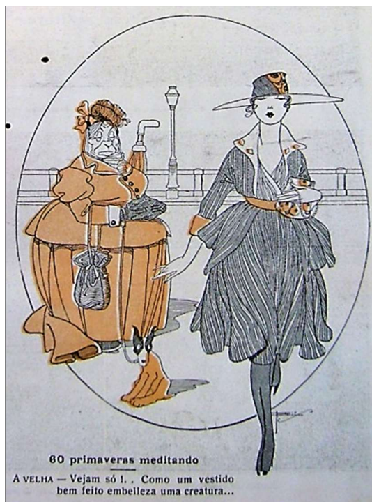
Imagem 07: “60 primaveras meditando”. Ilustrador: J. Carlos.

Sobre as possíveis implicações nos fatores educacionais para as mulheres, pode-se afirmar que elas precisariam de instrução que as preparasse para o ritmo que a organização social atingia. Na reivindicação nacional e mundial pelo sufrágio feminino, frequentemente abordada na Careta , há de se pensar que a aquisição e a exigência de novos direitos acompanhavam uma relativa necessidade de educação mais assistida, de espaços para debate feminino mais efetivo, visto que certa institucionalização das esferas da vida cotidiana, 18