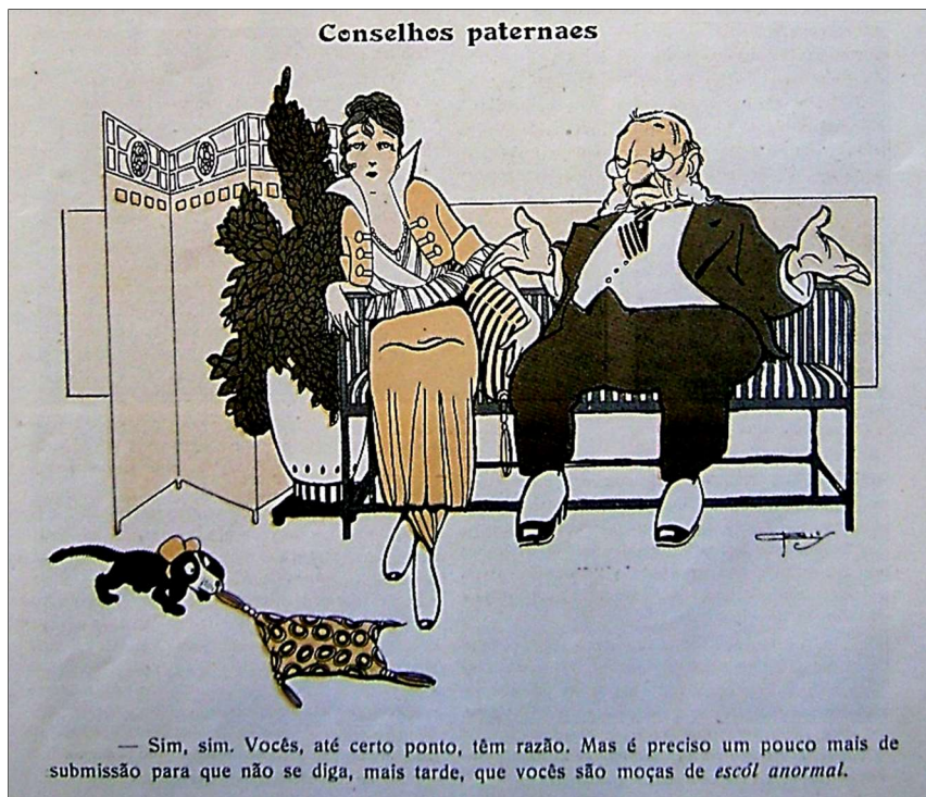
Imagem 01: “Conselhos paternaes” – charge. Careta (19/06/1915, p. 26). Ilustrador: J. Carlos.

O homem da charge parecia se preocupar com o bom comportamento da filha, numa conformação a padrões que evitasse a classificação da moça como anormal . Para tanto, ele declara: “[...] é preciso um pouco mais de submissão para que não se diga, mais tarde, que vocês são moças de escol normal ” (CARETA, 19/06/1915, p. 26). 8