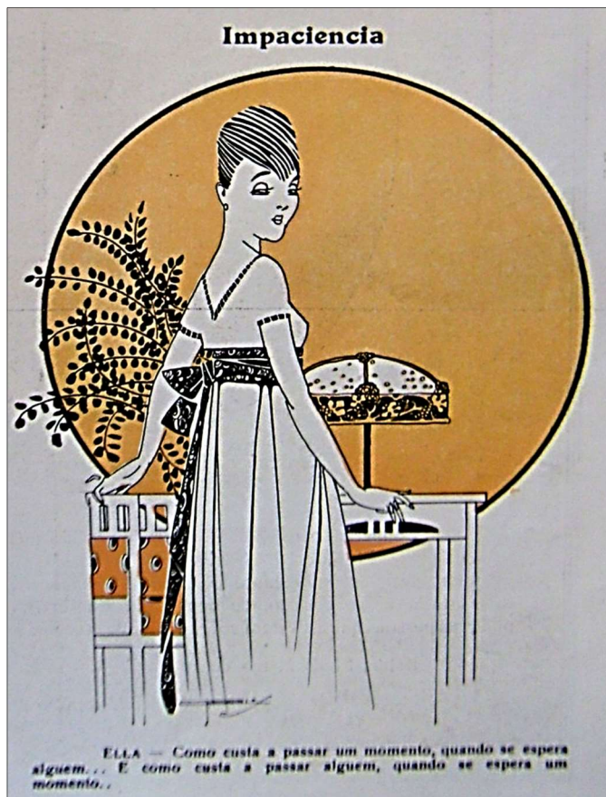
Imagem 08: Charge “Impaciência”. Ilustrador: J. Carlos.

seguir (imagem 08). Não se trata simplesmente de questionar o anseio da mulher pelo encontro de um parceiro, podendo se pensar até mesmo numa perspectiva da espécie em si, nas suas condições culturais e de reprodução, em que a aproximação entre masculino e feminino acontece. Poder-se-ia pensar as fases de maturação próprias do seu desenvolvimento, de corpo biológico feminino.