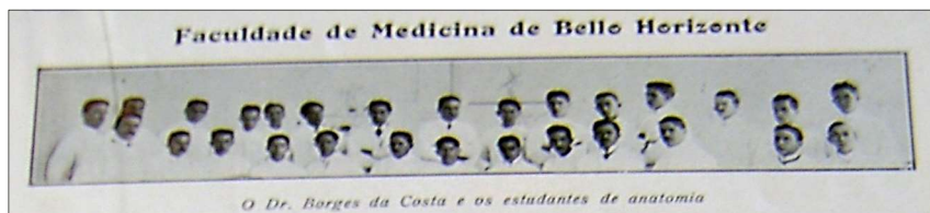
Imagem02: “Faculdade de medicina de Medicina de Belo Horizonte”.