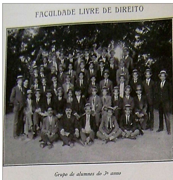
Imagem 03: “Faculdade livre de Direito”.