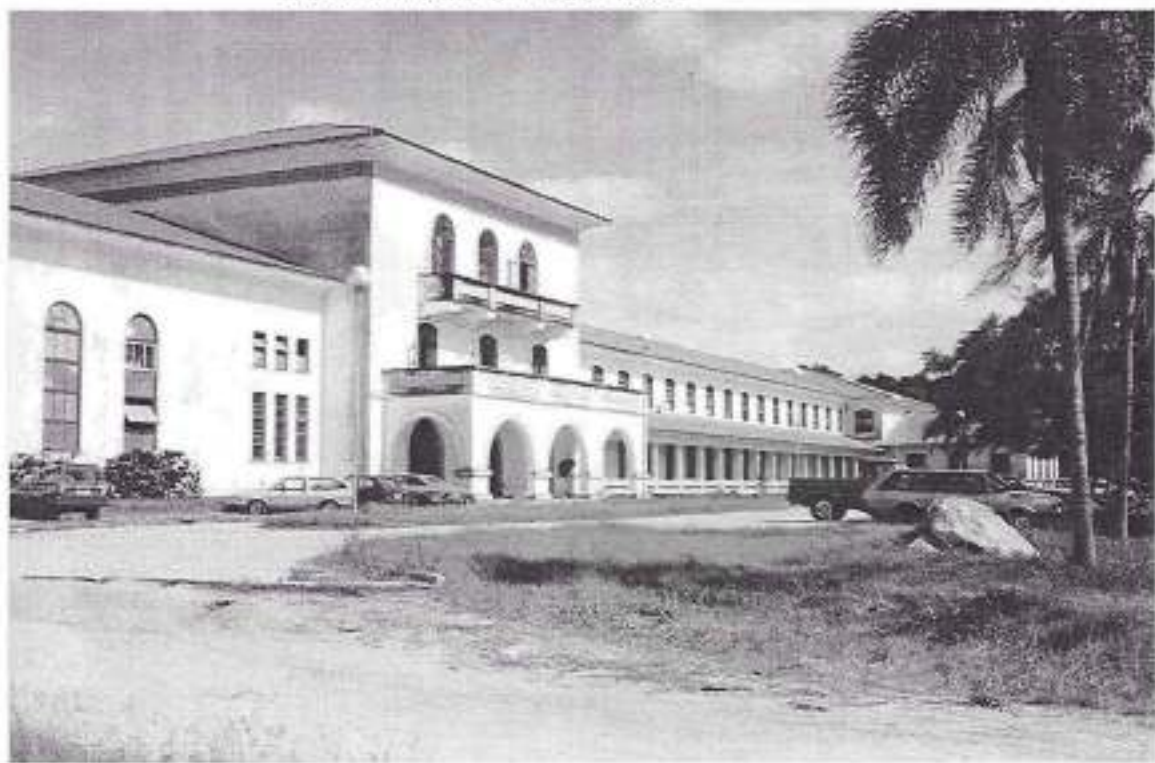
FACULDADE DE AGRONOMIA ELISEU MACIEL