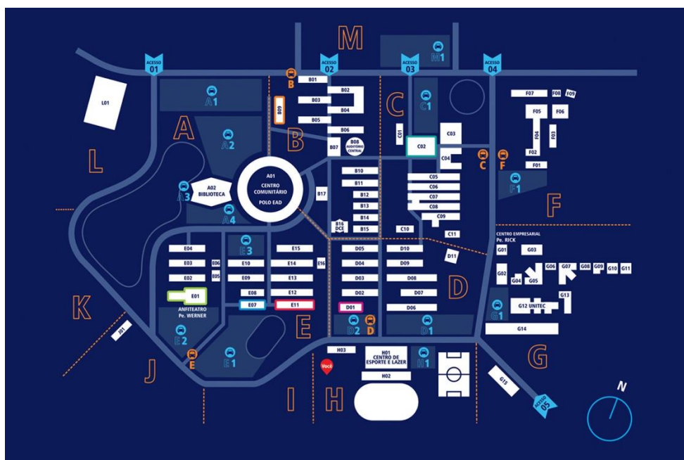
Figura 6 - Mapa do Ecossistema de Inovação TECNOSINOS em 2014.