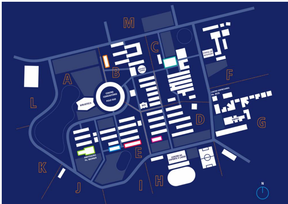
Figura 3 - Mapa do Ecosistema de Inovação TECNOSINOS em 2018.