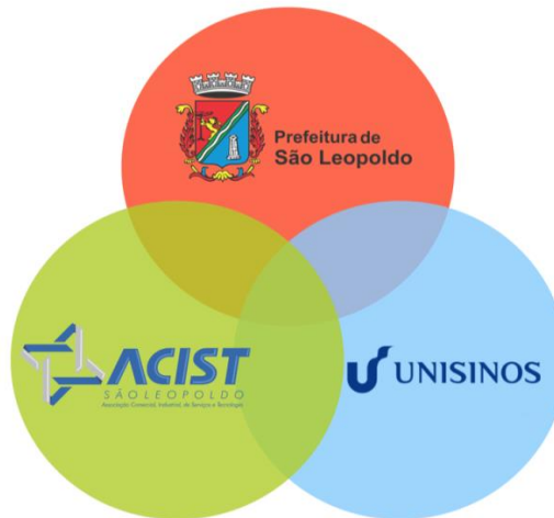
Figura 1 - Modelo hélice tríplice TECNOSINOS.

administrativo, 8 o modelo de governança do Parque Tecnológico de São Leopoldo (TECNOSINOS) adquire a configuração da hélice tríplice (Figura 1).