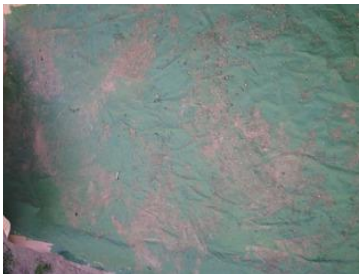
Fig. 07. Giordano Alves Costa.

Impressão do Artista. Impressão sobre papel reciclado. 2013