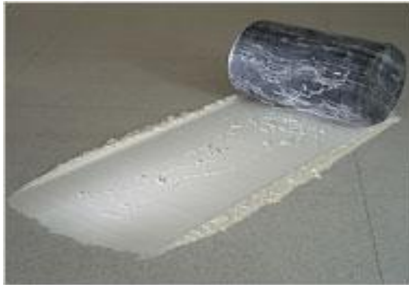
Fig 05. Luciano Fabro.

Destaque-se um pensamento panorâmico e ímpar acerca da textura gerada pela marca-impressão, e suas consequências.