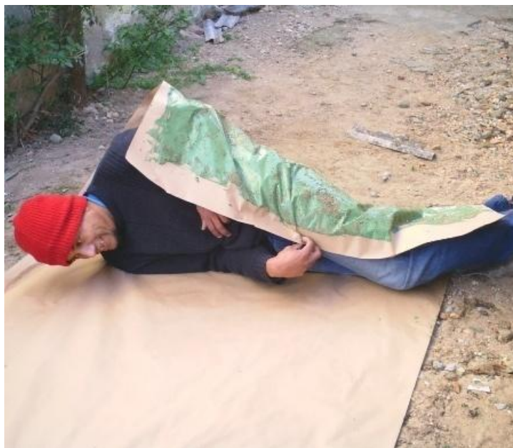
Fig. 06. Giordano Alves Costa.