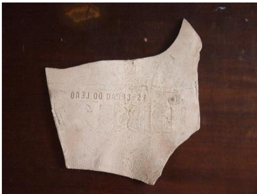
Fig. 02. Giordano Alves Costa Um Carro Animal . Impressão em couro, 2010

O objeto prensado agora é a presença ausência, o vestígio visualizado em seu índice, é o conceito é a ação. Está em aberto, transferido para o couro, impregnando pela textura, pela ferrugem ou por fragmentos soltos do ferro, tornando o suporte mais áspero e exaltando à sensação tátil, questionando os possíveis aspectos da figura apresentada após cada impressão experimentada (ALVES, 2013). Neste sentido cito, Merleau-Ponty: