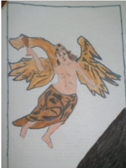
Figura 1: Aluno A, 7ª série, a partir das obras de Aleijadinho - 30.08.11

No trabalho posterior, que versava sobre formas geométricas, os alunos fizeram várias composições de círculos com o uso de compassos, CDs e moedas, e dentro desses círculos criavam pinturas com linhas e texturas (Fig. 2). No prosseguimento da atividade, os alunos deveriam fazer um trabalho de monocromia em folha A4, com formas de quadrados utilizando cores quentes ou frias.