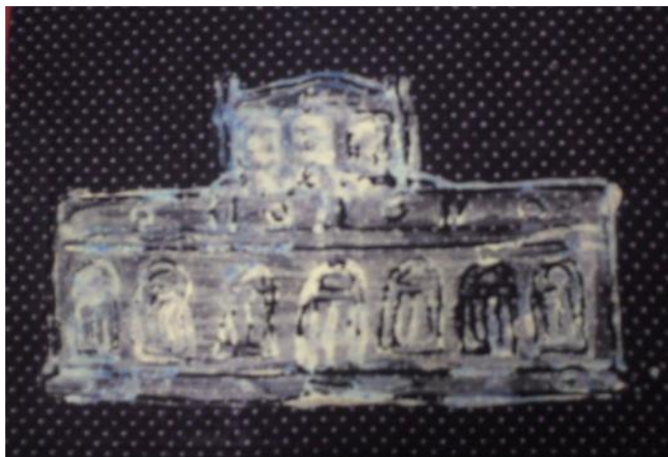
Figura 3: Gravura em tecido do aluno C, 8ª série, a partir do tema: prédios históricos da cidade de Pelotas – 30.08.11

Dando continuidade à proposta, a professora pediu para que os alunos fotografassem elementos ou situações de seu cotidiano, que despertassem seus interesses. Posteriormente deveriam trazer suas fotos para a professora ver. Os trabalhos foram feitos em grupos de três a quatro alunos com o uso de câmeras digitais (Fig.4 e 5).