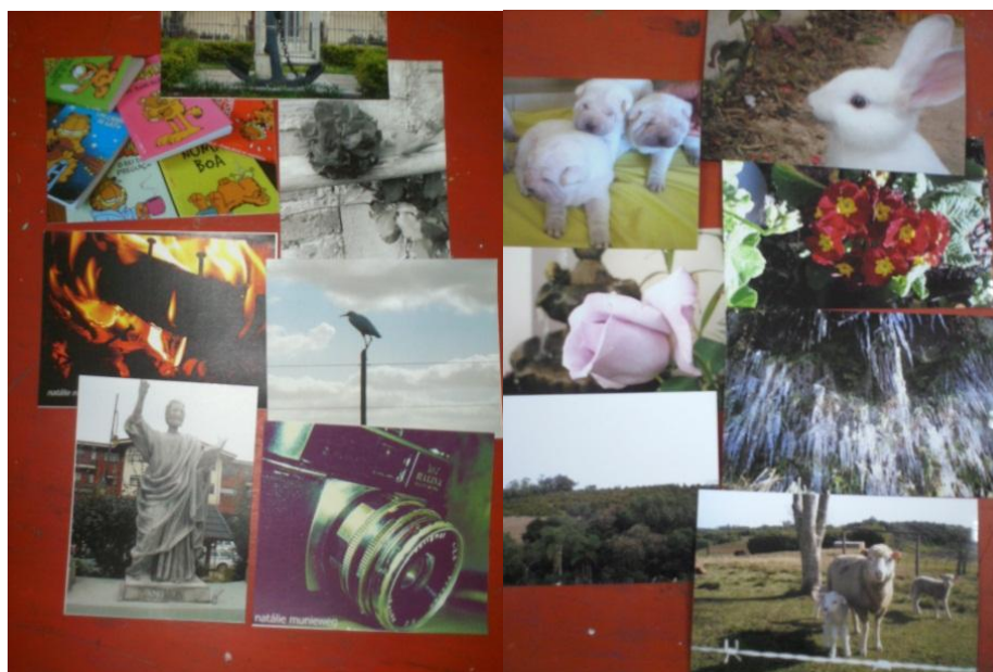
Figura 4 (esquerda): Aluno D, 8ª série, fotografia do cotidiano – 27.09.11

Dando continuidade à proposta, a professora pediu para que os alunos fotografassem elementos ou situações de seu cotidiano, que despertassem seus interesses. Posteriormente deveriam trazer suas fotos para a professora ver. Os trabalhos foram feitos em grupos de três a quatro alunos com o uso de câmeras digitais (Fig.4 e 5).